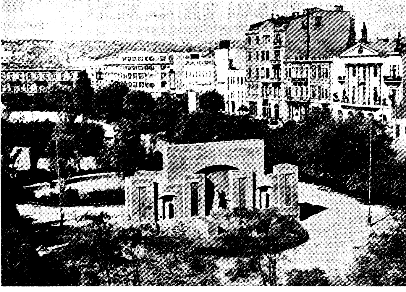
Гор. Баку. Общий вид площади Свободы. В центре — памятник 26 бакинским комиссарам.

ЗАОЗЕРНОЕ (Красноярский край), 8 декабря. (Норр. «Правды»). В Рыбинском районе разрабатывается месторождение бурых углей, расположенное вблизи реки Ирша. Заключается строительство двух новых шахт, которые будут сланы в эксплуатацию в первом квартале будущего года. Производительность каждой из них равна 100 тыс. тонн угля в год. В ближайшие дни здесь будут заложены еще две новых шахты. В будущем году Рыбинский район даст подмиллиона тонн бурого угля. Около угольного месторождения вырос рабочий городок. В нем построены полтора десятка жилых домов, общежития, здания полной средней школы, амбулатория, магазина, столовой и т. д.