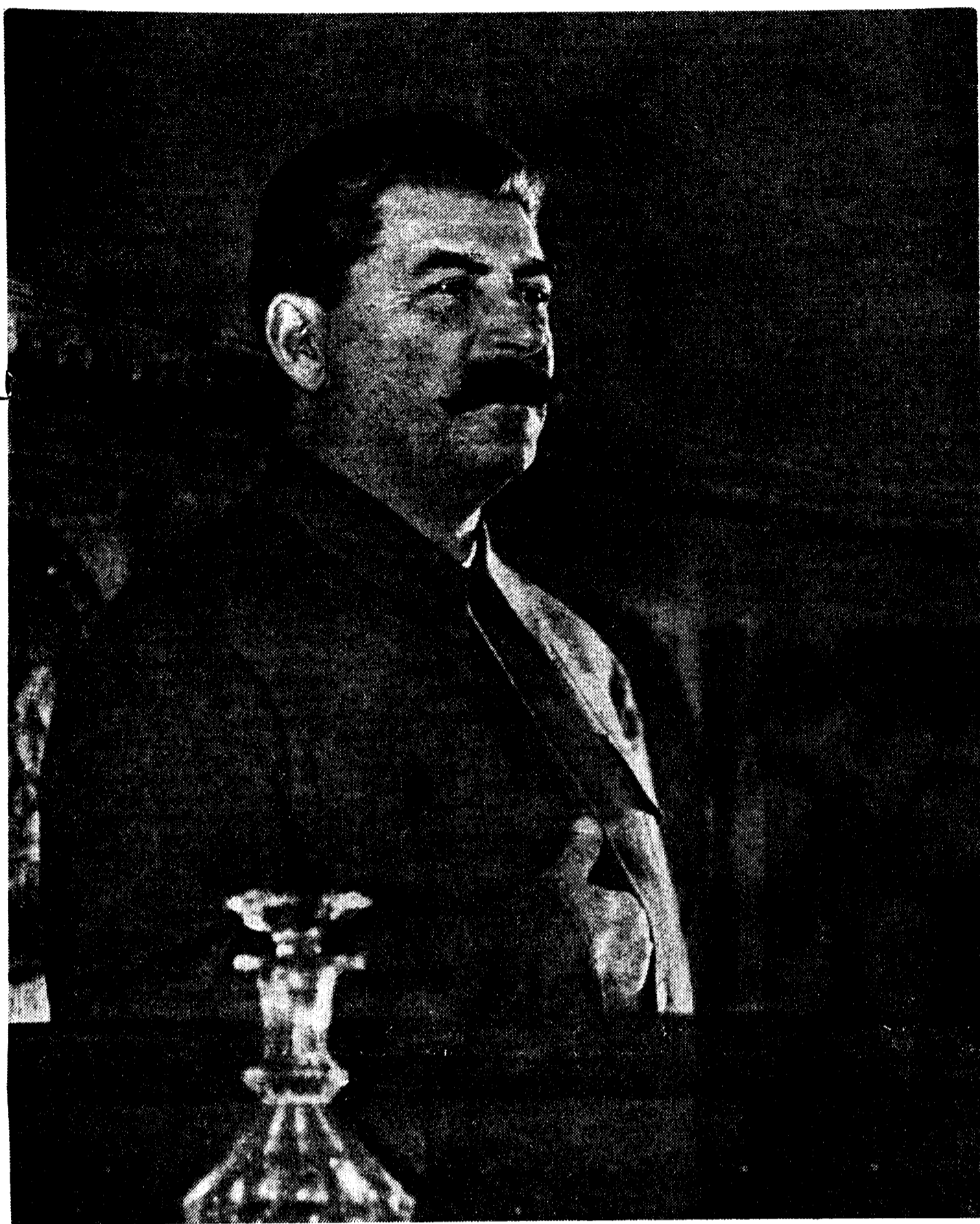
Товарищ И. В. Сталин на трибуне Чрезвычайного VIII Всесоюзного Съезда Советов.

Вдохновляемый партией Ленина — Сталина, советский народ идет вперед, к новым победам коммунизма!