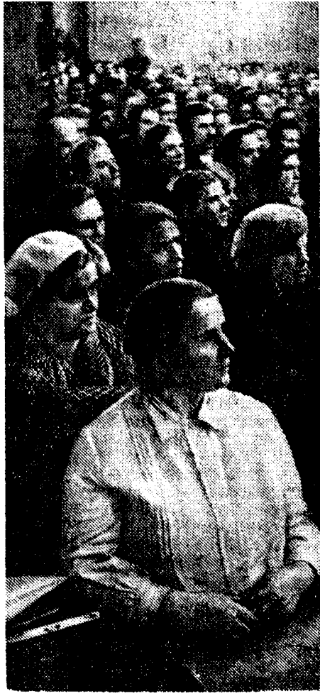
Партийный актив Кировского района г. Москвы слушает доклад о жизни и деятельности С. М. Кирова.