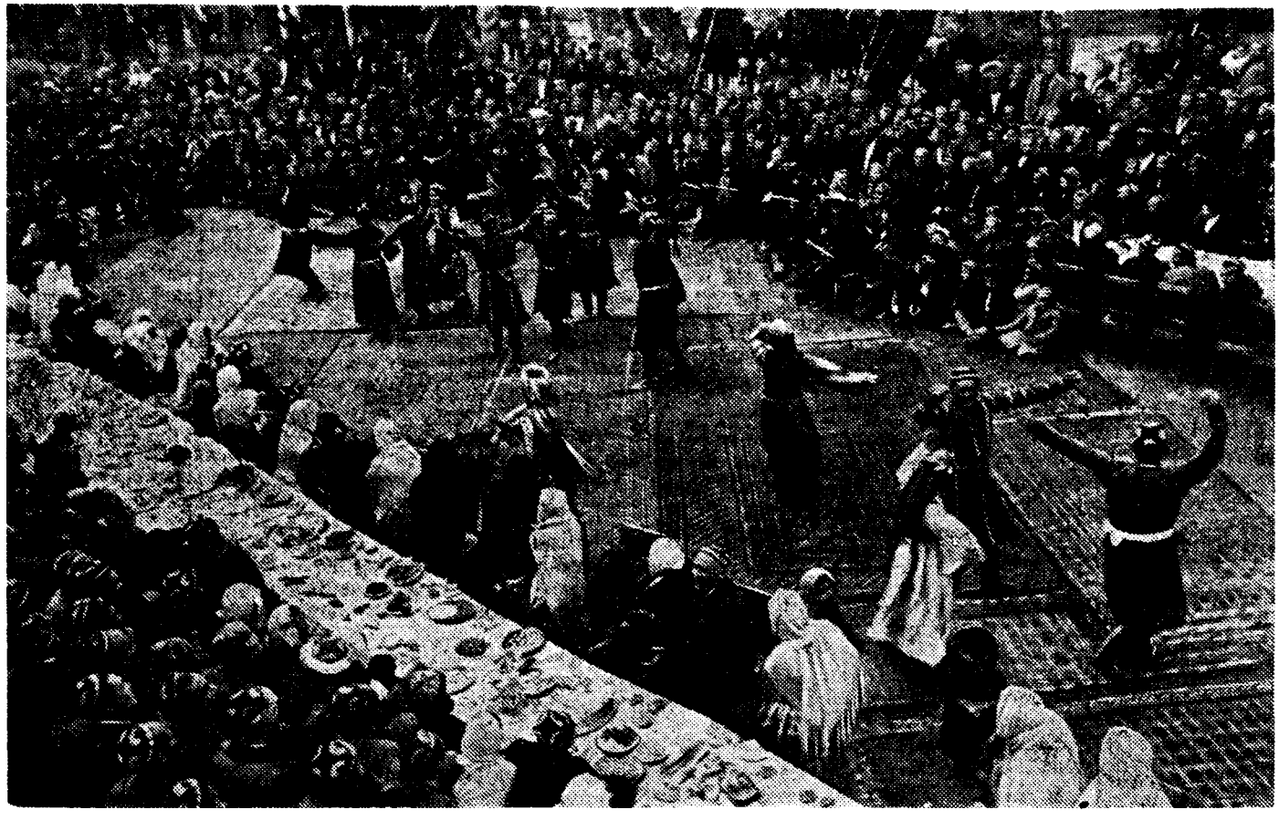
Праздник «той» в колхозе «Сталиничи» (Ленинский район, Узбекской ССР) в связи с выполнением годового плана.

Коломенский машиностроительный завод имени В. В. Куйбышева выпускает новые модернизированные электровозы серии «СМ». Новый электровоз существенно отличается от машины серии «СО». На нем установлены шесть моторов общей мощностью в 2.740 лошадиных сил, позволяющие развивать скорость до 85 километров в час. Уже выпущено одиннадцать электровозов серии «СМ». До конца года будет выпущено шестнадцать таких машин. Электровозы «СМ» курсируют на электрифицированном участке железной дороги имени Л. М. Кагановича.