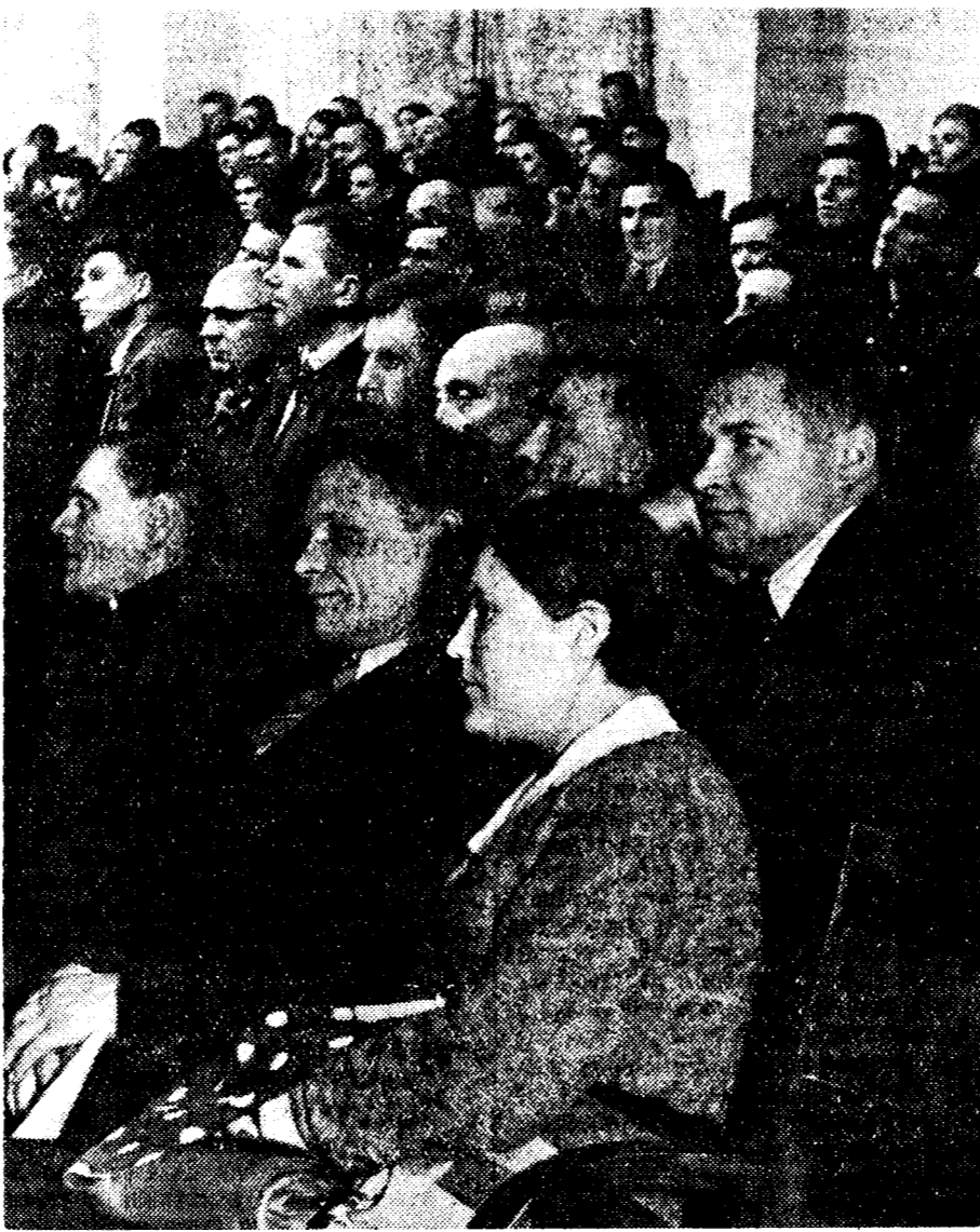
На собрании партийного актива Железнодорожного района гор. Москвы.