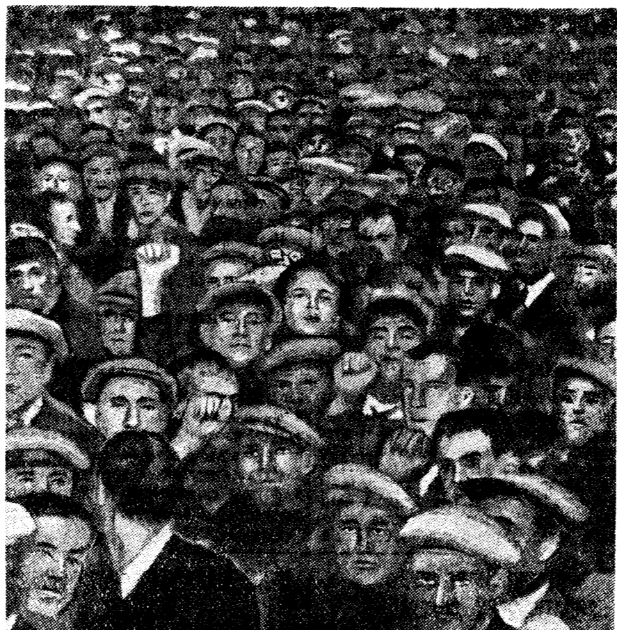
Борьба французских рабочих против чрезвычайных декретов. На снимке: митинг рабочих в предместье Парижа — Женилье.

звали бы глубокое разочарование в всех честных лейбористских последователей». Однако, не будучи уверенной в убедительности своих высказываний, «Таймс» тут же предпринимает попытку, что кое-где идея народного фронта будет вестать пробиваться и что не следует слишком рассчитывать на бесконечную разрозненность среди противников правительства. Поэтому, заключает «Таймс», надо подумать о более «сильном руководстве страной».