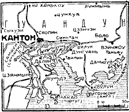
Восточнее Кантона японцы отступили из Вайчжоу, и бои теперь происходят в районе Пиншань и Тяньфу (важные пункты)

С каждым днем сражения близ Кантона становятся все более ожесточенными.