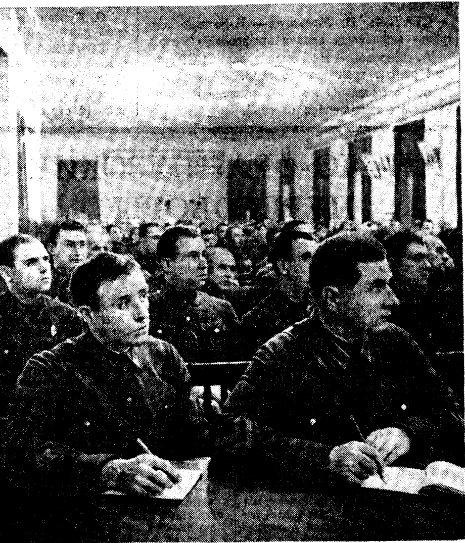
На лекции по истории ВКП(б) в Доме партийного образования Московского военного округа (г. Москва).

Массовый общественный контроль на заводах и фабриках — это не только и не столько контроль за качеством продукции, это прежде всего контроль за соблюдением прав рабочих и служащих.