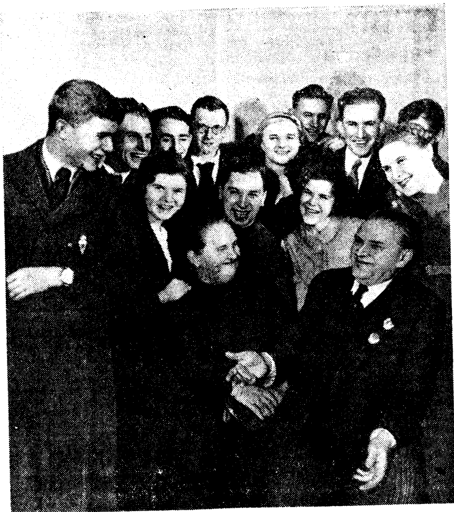
Народный артист СССР М. М. Тарханов среди участников рабочего самодельного театра Дворца культуры им. Горьбунова (г. Москва) в день принятия им шефства над этим коллективом.