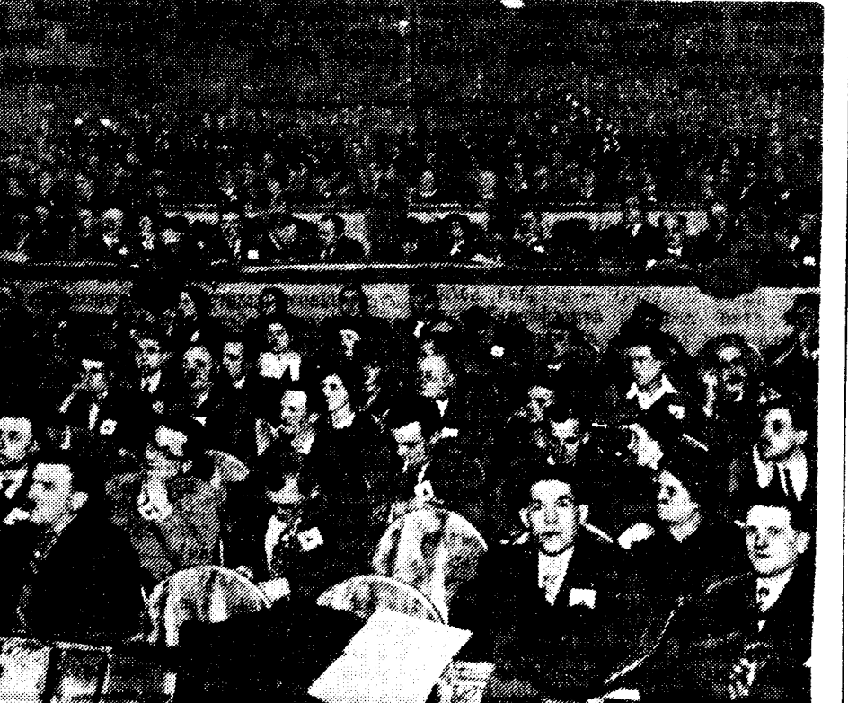
На конгрессе «Движения за мир и свободу» в Париже. (Фотохроника ТАСС).

ЛОНДОН, 23 ноября. (ТАСС). Берлинский корреспондент «Ньюс кроникл» сообщает, что в результате поездки генерала Боленшата в Лондон выявилась невозможность продолжения англо-германских переговоров в настоящий момент (в частности, о колониях) и нежелательность поездки Геринга в Лондон. Боленшат, по словам корреспондента, встретился с видными германскими членами консервативной партии, которые сообщили ему, что еврейские погромы в Германии «создали плохое впечатление в Англии».