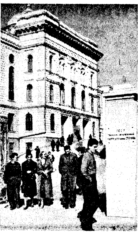
Тбилиси. У входа в Государственный университет имени Сталина (ноябрь 1938 г.).

22 ноября на железных дорогах Союза по плану 90.002 вагона—97,8 проц. плана, выгружено 88.277 вагонов—93,6 проц. плана.