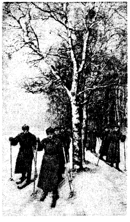
Зима в Архангельске. Лыжная тренировка бойцов.

ВОЛГОГРАД — опер. «Тихий Дон», в.ч. — бал. «Кавказский пленник»; Ойратский оперетт. — опер. «Тихий Дон», в.ч. — опер. «Псковская земля»; Уфа — опер. «Тихий Дон», в.ч. — опер. «Псковская земля»; Челябинск — опер. «Тихий Дон», в.ч. — опер. «Псковская земля»; Казань — опер. «Тихий Дон», в.ч. — опер. «Псковская земля»; Ленинград — опер. «Тихий Дон», в.ч. — опер. «Псковская земля»; Москва — опер. «Тихий Дон», в.ч. — опер. «Псковская земля»; Новосибирск — опер. «Тихий Дон», в.ч. — опер. «Псковская земля»; Омск — опер. «Тихий Дон», в.ч. — опер. «Псковская земля»; Ростов — опер. «Тихий Дон», в.ч. — опер. «Псковская земля»; Свердловск — опер. «Тихий Дон», в.ч. — опер. «Псковская земля»; Уфа — опер. «Тихий Дон», в.ч. — опер. «Псковская земля»; Челябинск — опер. «Тихий Дон», в.ч. — опер. «Псковская земля»; Ярославль — опер. «Тихий Дон», в.ч. — опер. «Псковская земля».