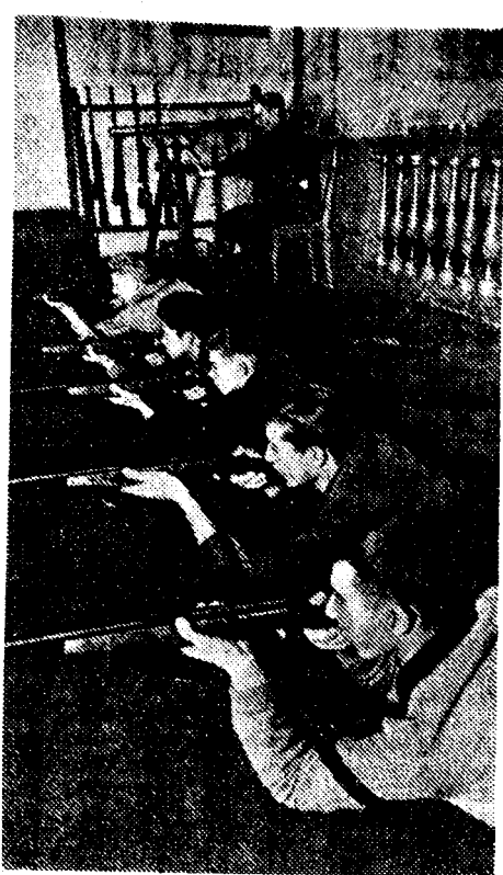
В Центральном Доме Красной Армии происходит стрелковое соревнование детей восточного Московского гарнизона.

НОВЫЙ ФИЛЬМ ПРОИЗВОДСТВА МОСКОВСКОЙ КИНОСТУДИИ