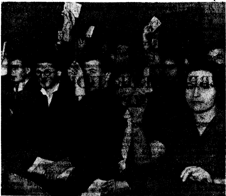
Комсомольская конференция в Московском государственном университете, посвященная выборам комитета ВЛКСМ.

На этих фактах мы еще раз убедились в том, что только систематическая проверка может обеспечить действенность и живость принимаемых решений. Однако мы не сумели еще обеспечить своевременного контроля за выполнением всех своих решений. Крупнейшим нам недостатком заключается в том, что мы еще слабо привлекаем к проверке исполнения партийный актив.