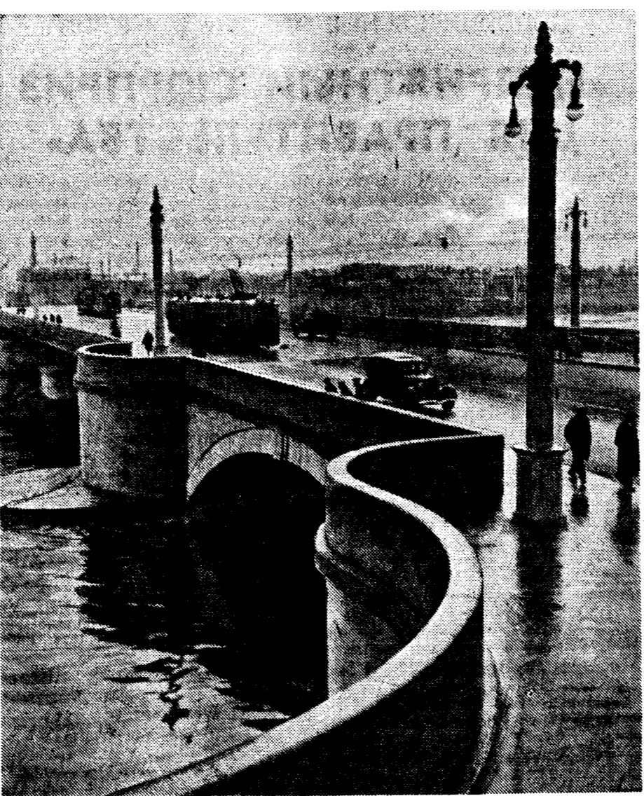
Заново перестроенный мост имени лейтенанта Шмидта через реку Неву в г. Ленинграде.

В стихотворении «Рассказ Матрены» старая колхозница вспоминает, как она пришла в колхоз, соревнуясь с приехавшей из