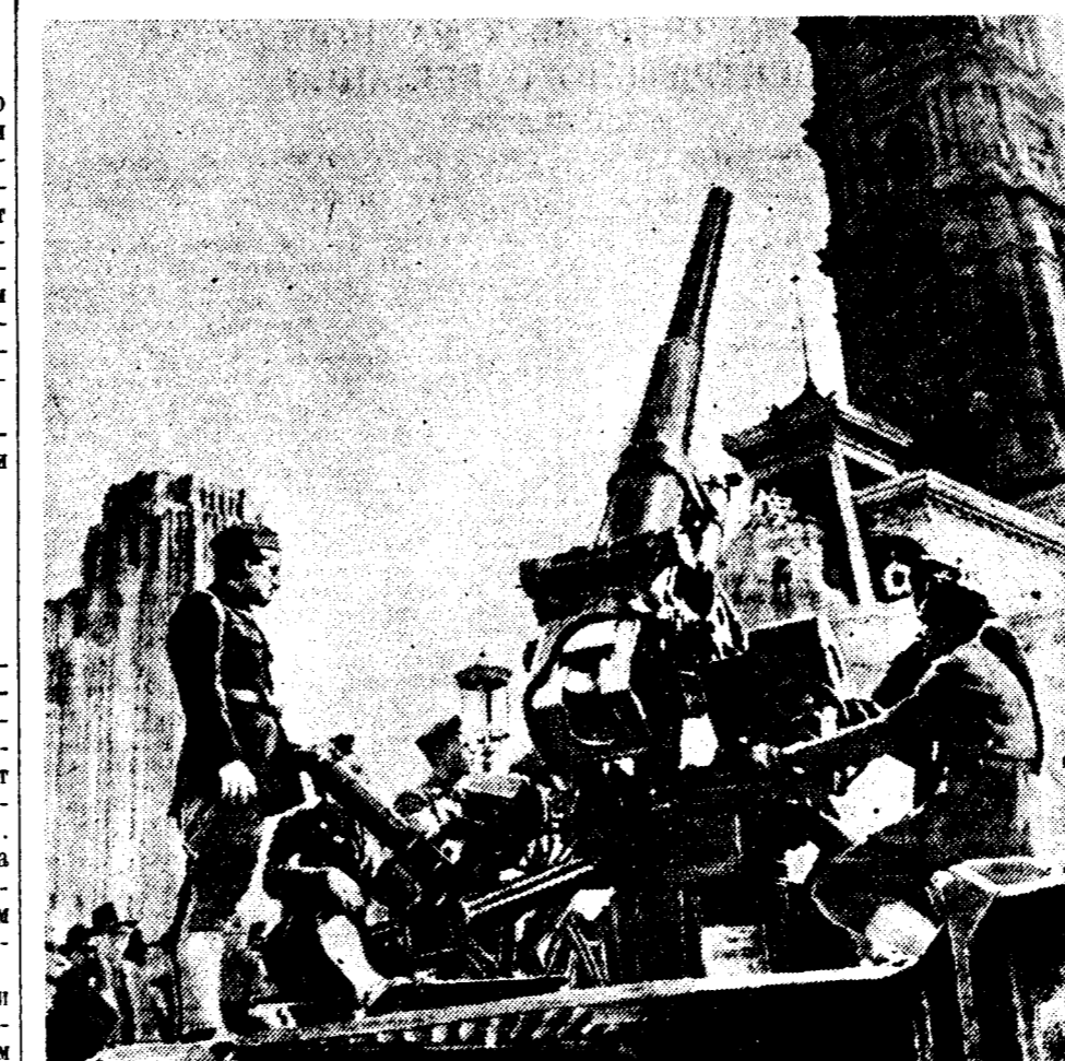
Военные маневры в США. На снимке — противовоздушная оборона г. Филадельфия. Зенитное орудие, установленное около городской ратуши.

ЛОНДОН, 18 ноября. (ТАСС). По сообщению дипломатического обозревателя газеты «Ивинг стандард», вчера югославский принц-регент Павел выехал из Белграда в Лондон. Касаясь неми этой поездки, обозреватель замечает, что в настоящее время Югославия желает увеличить объем торговли с Англией и уже настаивает перед Лондоном на необходимости расширения существующего торгового соглашения.