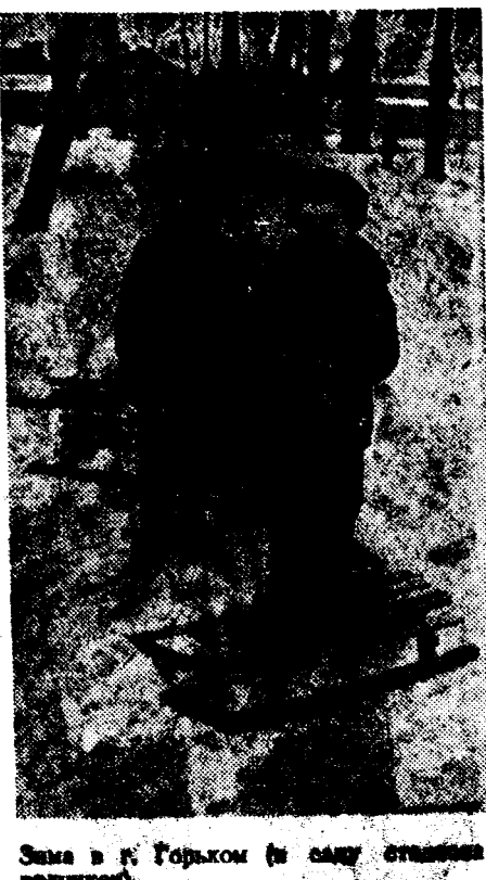
Запись в г. Горьком (в саду станции железной).

Мы получили сведения о том, что японцы подвозят к линии фронта большой резерв. Пополнение было погружено на пять океанских кораблей, движущихся вверх по реке Янцзы.