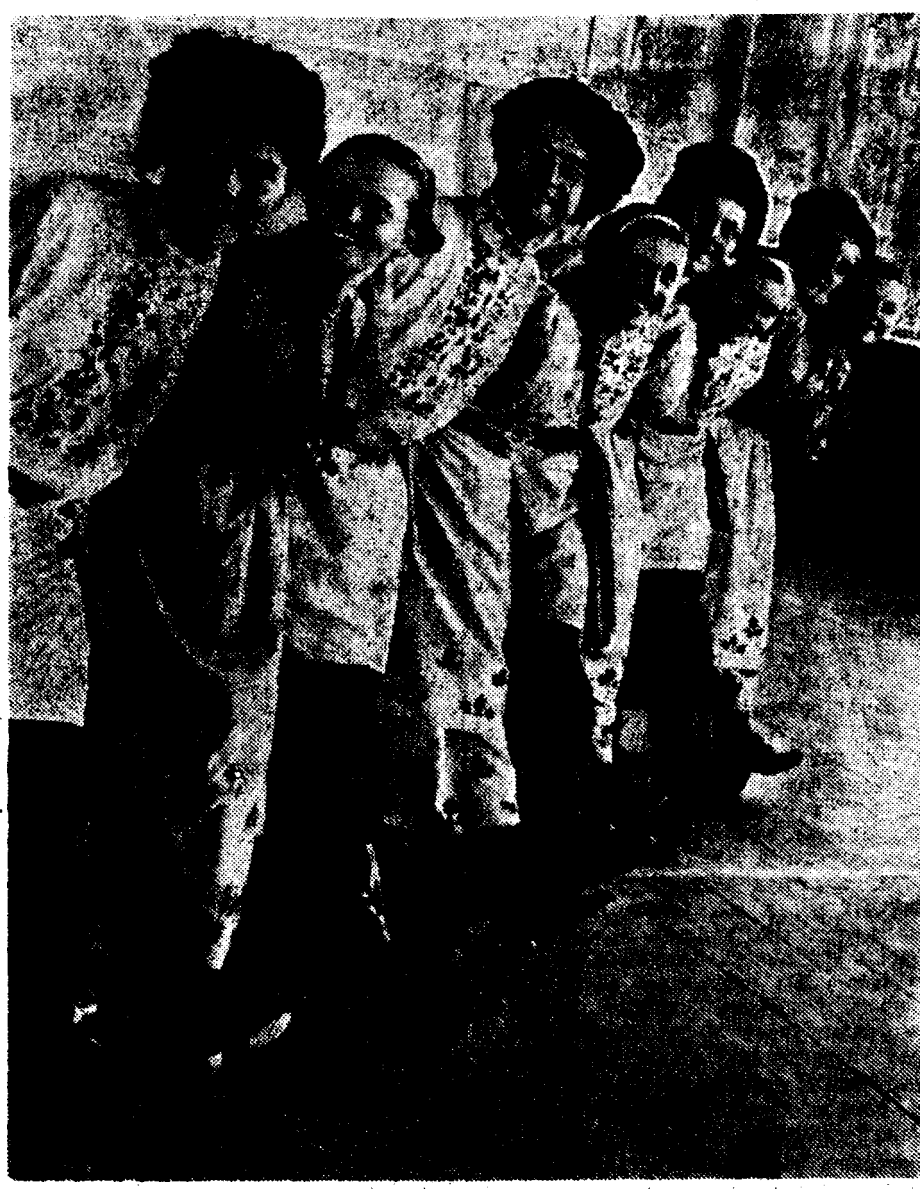
Государственный ансамбль народного танца Союза ССР. На снимке: молдавский танец.