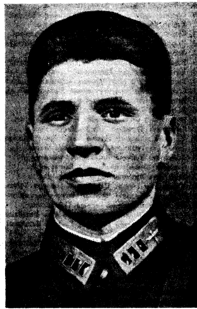
Герой Советского Союза полковник Ф. П. Полянин.