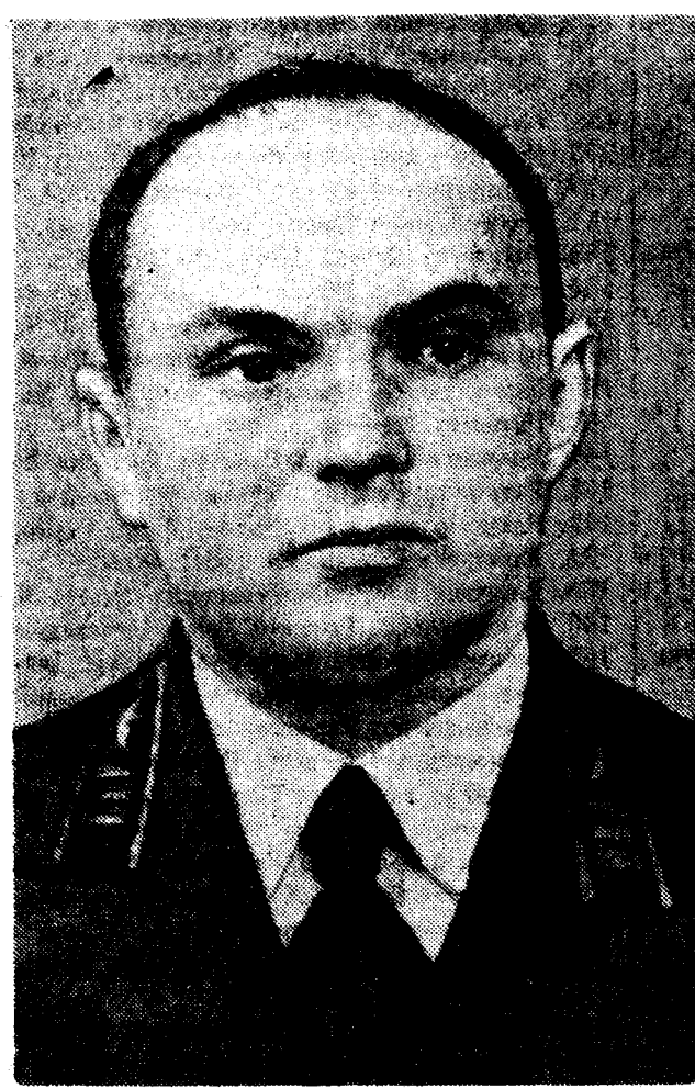
Герой Советского Союза полковник А. С. Благовещенский.