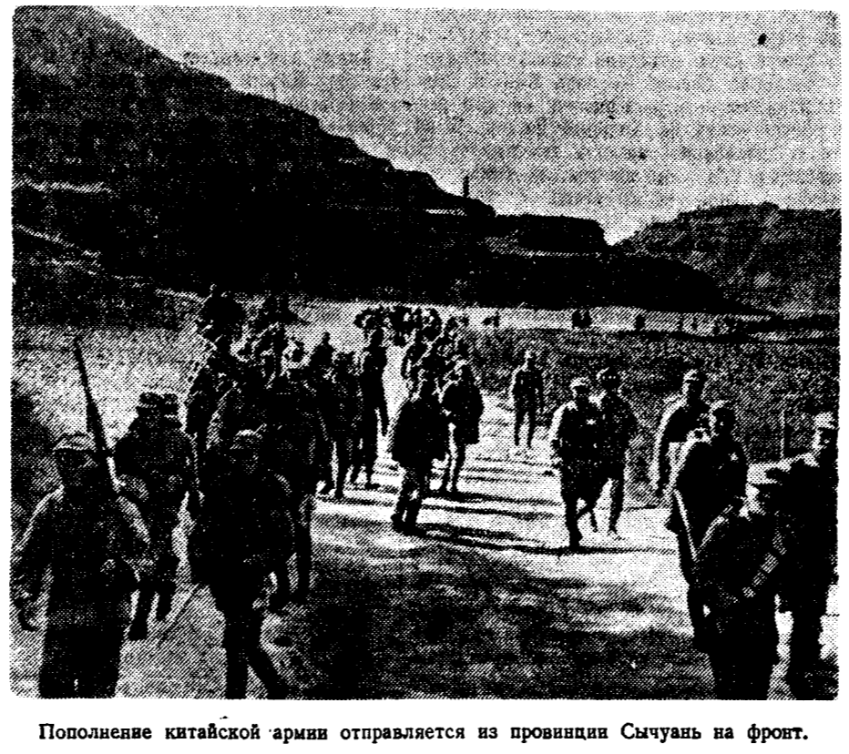
Пополнение китайской армии отправляется из провинции Сычуань на фронт.

СОФИЯ, 15 ноября. (ТАСС). По сообщению Болгарского телеграфного агентства, формирование нового болгарского правительства король вновь поручил Киоссеянову. Премьер-министр Киоссеянов получает в новом правительстве также пост министра иностранных дел. Из прежнего состава в новом кабинете остаются лишь военный министр генерал Даскалов, министр общественных работ Уанев и министр торговли Кожухаров. Новыми членами правительства назначены: Нелев — министром внутренних дел, профессор Филов — министром просвещения, Божалов — министром финансов, Аврамов — министром путей сообщения, Вагрянов — министром земледелия и Иотов — министром юстиции.