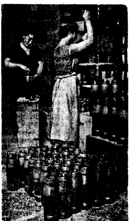
Женщины республиканской Испании на одном из военных заводов.

После того как будет воздвигнут мавзолей, прах Кемал Ататюрка будет перенесен в этот мавзолей.