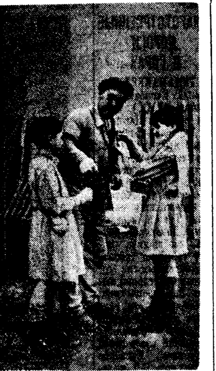
Сбор средств для организации продовольственной помощи республиканской Испании в одном из рабочих кварталов Парижа.

Одновременно утверждают, что германское правительство через находящегося в Берлине словацкого министра передало чехословацкому правительству предложение обеспечить избрание в президенты министра иностранных дел Хвалковского и рекомендовало в состав нового правительства в качестве премьера Черны (аграрий), а на пост министра иностранных дел — Криво (аграрий).