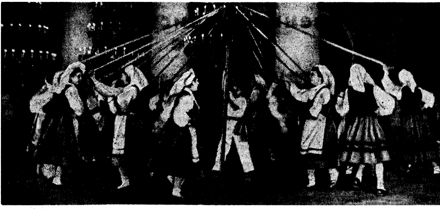
Танец басков «Хота» в исполнении испанских детей в Колонном зале Дома союзов.