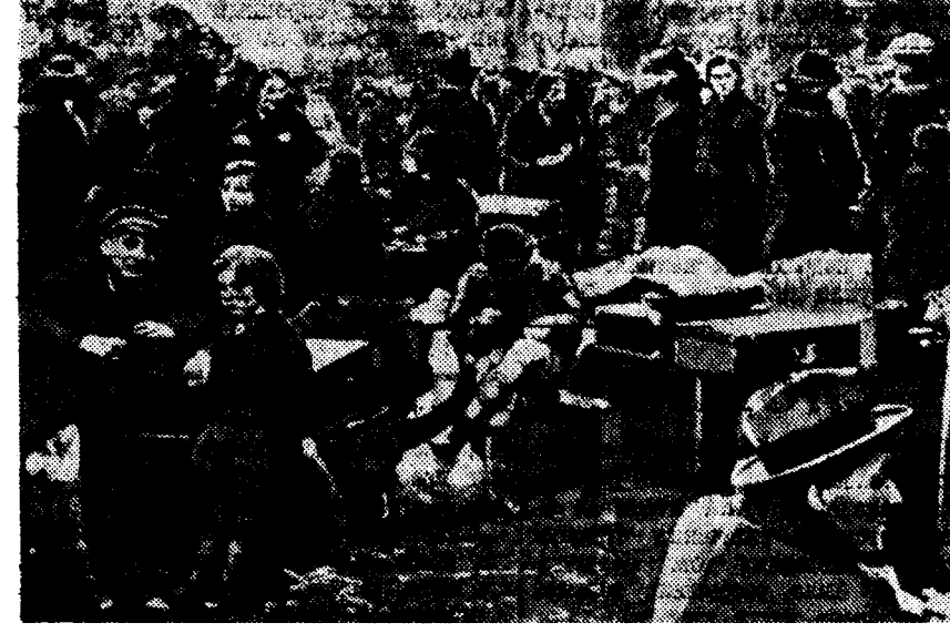
Польские подданные, высланные германским правительством в Польшу, под открытым небом в районе польско-германской границы.

Вторая (северо-восточная) китайская колонна, которая заняла Фомань (в 15 км юго-западнее Кантона) и развернула операции на островах в дельте реки Янцзун.