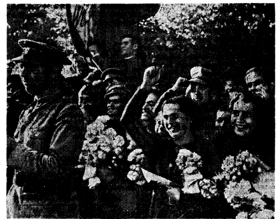
Население Барселоны провожает уезжающих из республиканской Испании бойцов интернациональных бригад.