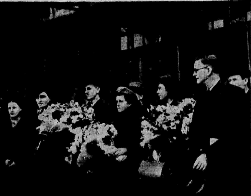
На празднование XXI годовщины Великой Октябрьской социалистической революции прибыла в Москву делегация английских и южно-африканских профсоюзов. На снимке: делегация английских и южно-африканских профсоюзов на Белорусском вокзале.

Перед кинотеатром «Наука и знание» — огромное и почетное дело деятельности. Его