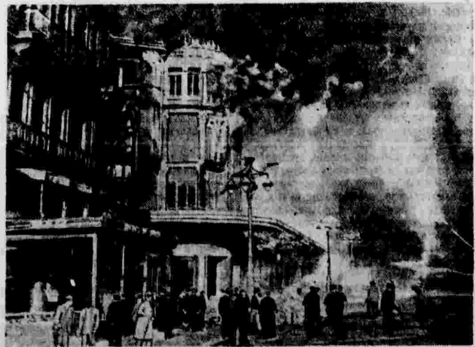
Пожар в городе Марселе (Франция).