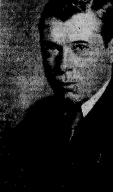
Молодой человек в форме, участник строительства.

Советская молодежь пользуется всеми благами социалистического строя. Народ нашей страны под руководством товарища Сталина уничтожил ка-