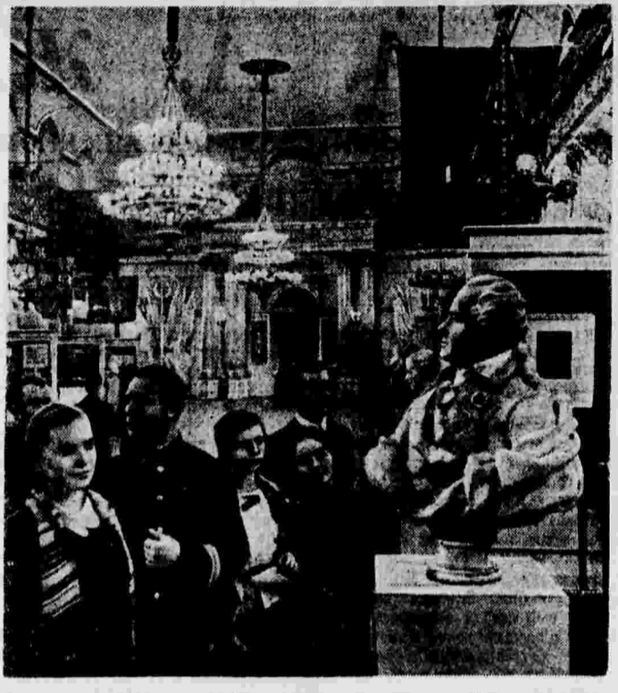
В помещении «Эрмитажа», в Ленинграде, открыта выставка «Военное прошлое русского народа». На снимке: группа посетителей выставки у бюста полководца Суворова.