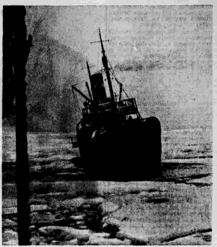
Ледокольный пароход «Седов» в Северном Ледовитом океане (сентябрь 1938 г.).

ПАРИЖ, 23 октября. (ТАСС). Сегодня во Франции происходят выборы в сенат. Избирается 97 сенаторов. (По конституции каждые 3 года переизбирается одна треть сената).