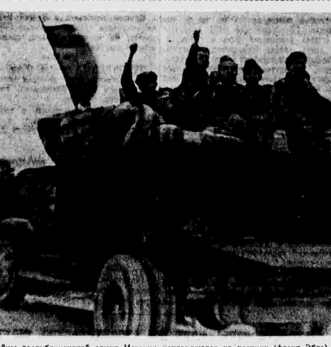
Бойцы республиканской армии Испании направляются на позиции (фронт Эбро).

Говоря о международном значении борьбы испанского народа, Ламонеда отметил, что «в то время, как реформистские вожди международного рабочего движения колебались, подлинные интернационалисты сражались за Испанию в рядах интернациональных бригад».