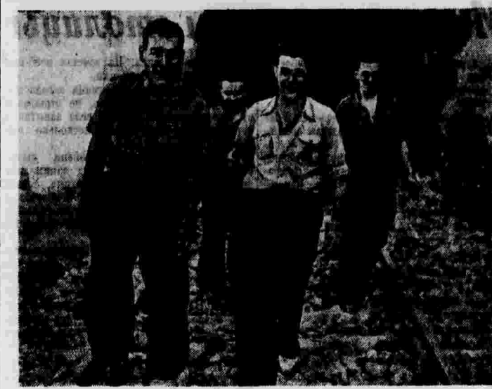
Группа командиров испанской республиканской армии на участке Эбро.