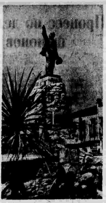
Памятник В. И. Ленину на Театральной площади в г. Орджоникидзе.

В театральном музее Грузии (Тбилиси) открылась выставка «Грузинские народные артефакты». На выставке собрано свыше 200 экспонатов, иллюстрирующих историю грузинских народных артефактов.