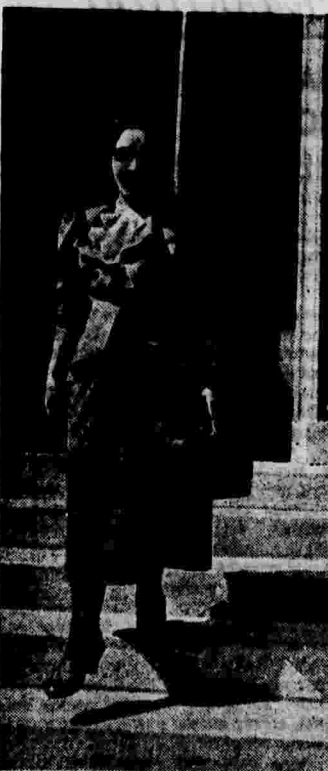
Командир самолета «Родина» В. С. Грозодубова (сентябрь 1938 г.).