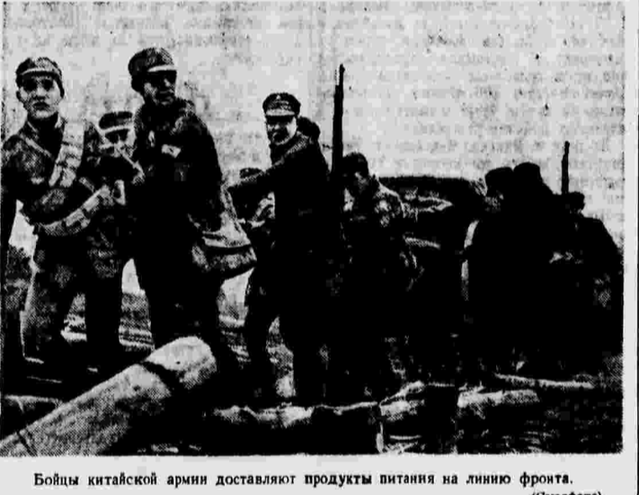
Бойцы китайской армии доставляют продукты питания на линию фронта.

так и тех, которые находятся на территории, захваченной итежниками. Было изменено в отношении тех, кто умер за свободу и независимую Испанию, если бы мы пошли на мир до того, как иностранные захватчики покинут окончательно испанскую территорию. До тех пор, пока интервенция продолжается, хотя ее и пытаются лояло прикрыть, наше решение положить предел этой интервенции остается непоколебимым».