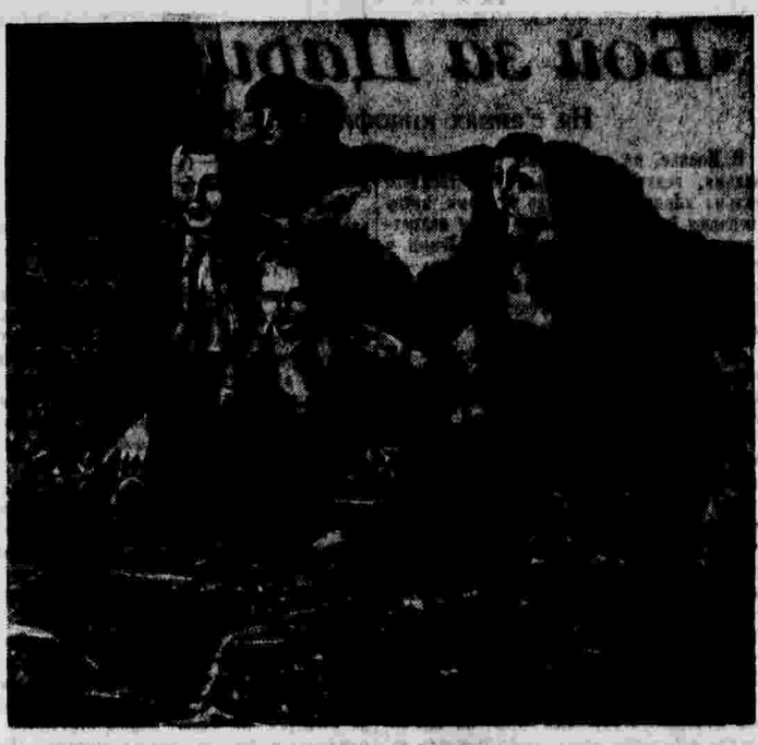
Беженцы из районов Чехословакии, оккупированных германскими фашистами, в местечке Штетти, близ г. Мальник.

«Утром 30 сентября можно было думать, что мир установлен, и я хотел, чтобы эта дата была ознаменована соответствующим образом. Увы! Последующие часы показали, какой ценой был куплен так называемый «мир»: ценой отказа от наиболее священных прав и ценой расчленения нашего дорогого союзника. Может ли в таких условиях стоять вопрос об ознаменовании даты, которая является для нас несчастьем и позором?».