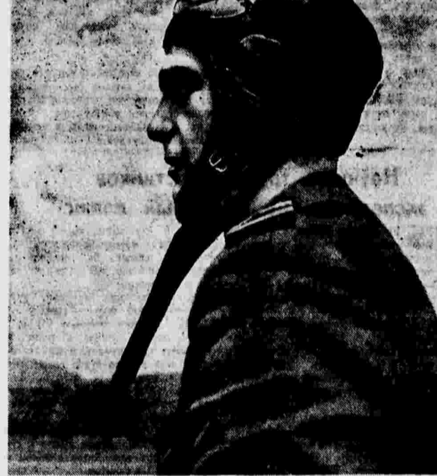
Андрей Лакотин — летчик республиканской армии Испании. В воздушных боях с фашистской авиацией сбил 13 итальянских «Фиатов» и 4 немецких «Юнкерсов».