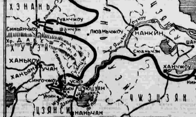
Линия фронта на 10 окт. Основные направления японского наступления.

Объектами японского наступления на этом направлении были города Гуанчжоу и Шанчэн. Эти пункты были заняты японцами к 19 сентября. Развивая дальнейшее наступление по посевным дорогам на запад, японские части захватили 22 сентября Ломань.