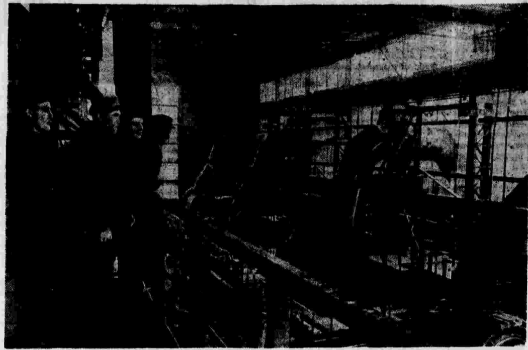
Пуск первой очереди Мончегорского медно-никелевого комбината. На снимке: один из цехов металлургического завода. Слева: группа стахановцев уральских медеплавильных заводов, командированных в помощь мончегорцам для освоения агрегатов.

На шахте № 16 Волоховского района 35 молодых горняков досрочно выполнили годовые нормы. Там создана комсомольско-молодежная лава. На шахте № 16 Шаекинского района организован комсомольско-молодежный участок.