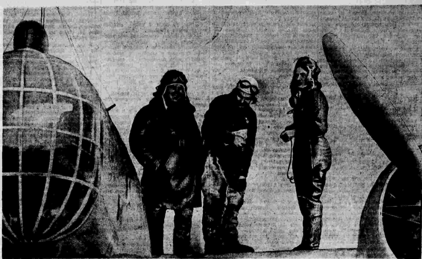
Экипаж самолета «Родина» перед стартом на Шелковском аэродроме (24 сентября 1938 года). Слева направо: 2-й пилот капитан П. Д. Осипенко, командир самолета В. С. Гризодубов и штурман старший лейтенант М. М. Раскова.

За стахановскую работу в IV квартале! За новые победы социалистического хозяйства!