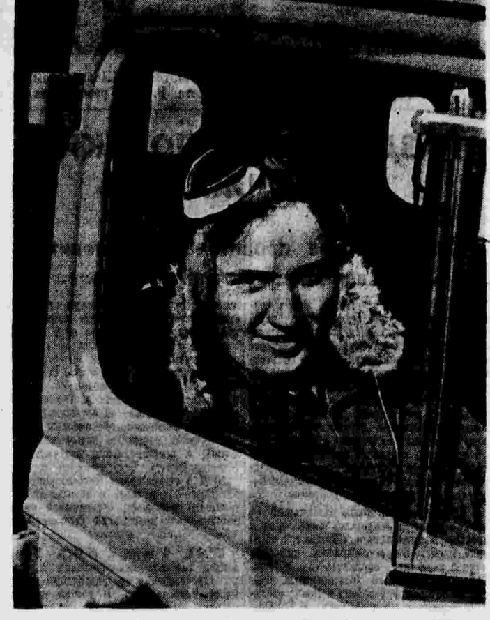
Штурман самолета «Родина» старший лейтенант М. М. Раскова в автомашине. (Сентябрь 1938 года).