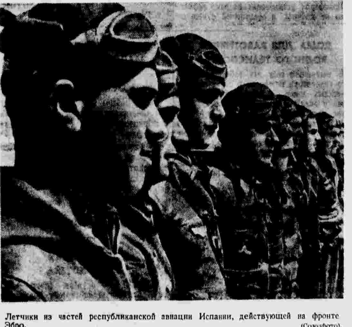
Легчики из частей республиканской авиации Испании, действующей на фронте Эбро.

ХАНЬКОУ, 8 октября. (ТАСС). Газета «Дагуобао» опубликовала заявление генерал-губернатора провинции Синьсян Шен Шин-чай. В своем заявлении Шен Шин-чай высказывается за поддержку правительства Чан Кай-ши и отмечает, что население провинции готово активно участвовать в освободительной войне. В Синьсяне достигнуто полное объединение 14 народов, населяющих его обширную территорию. Предполагается организация военного обучения населения.