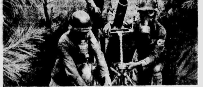
Военные действия в Китае. Обучение китайских бойцов стрельбе из бомбомета.

Разночленные цены на хлеб, мясо, крупы и другие продовольственные товары повысились за это время на 8—10 процентов.