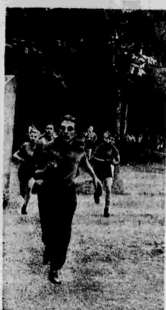
Вчера в Сокольниках (Москва) был проведен детский кросс имени К. Е. Ворошилова. На снимке: один из забегов для юниоров на 1000 метров.