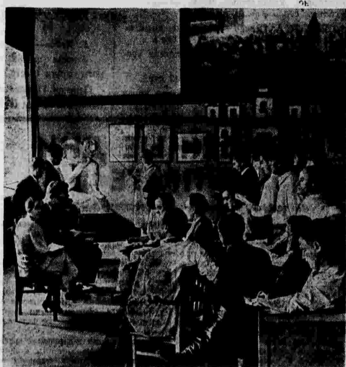
Изучение Истории ВКП(б) пропагандистами г. Москвы по наглядным пособиям в Центральном музее В. И. Ленина (в зале «Революция 1905 года»).