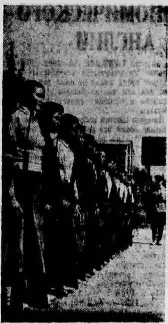
Студенты Казахского педагогического института (г. Алма-Ата) на строительных занятиях.