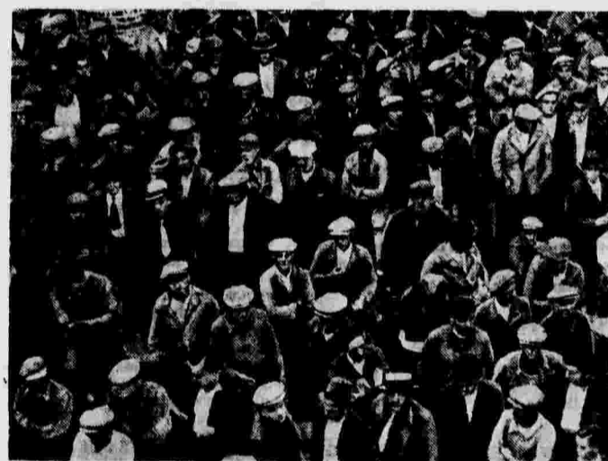
Митинг марсельских докеров в защиту закона о 40-часовой рабочей неделе.

ПАРИЖ, 21 сентября. (ТАСС). Агентство Эспанья передает, что 18 и 19 сентября в республиканской Испании произошло призыв двух резервов запаса в армию. Все резервисты явились точно в назначенные сроки на призывные пункты. Призывы проходили в обстановке большого подъема.