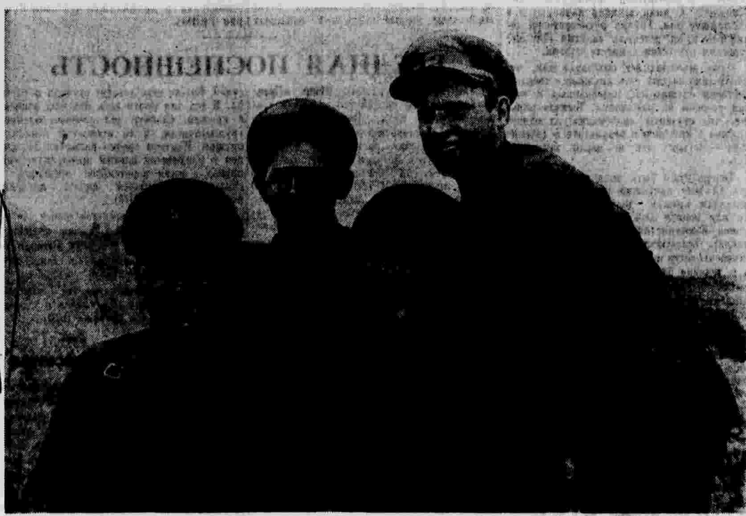
Дальневосточные пограничники, участвовавшие в первом бою с японцами на высоте Завоевной в ночь на 31 июля 1938 года.