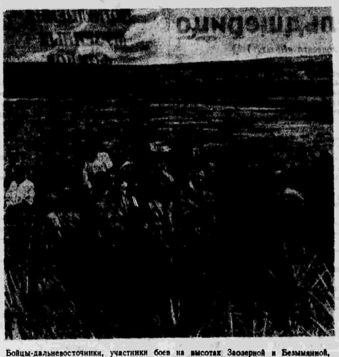
Бойцы-дальневосточники, участники боев на высотах Заозерной и Безымянной, после боя принимают душ на берегу озера Хасан. (Август 1938 года).