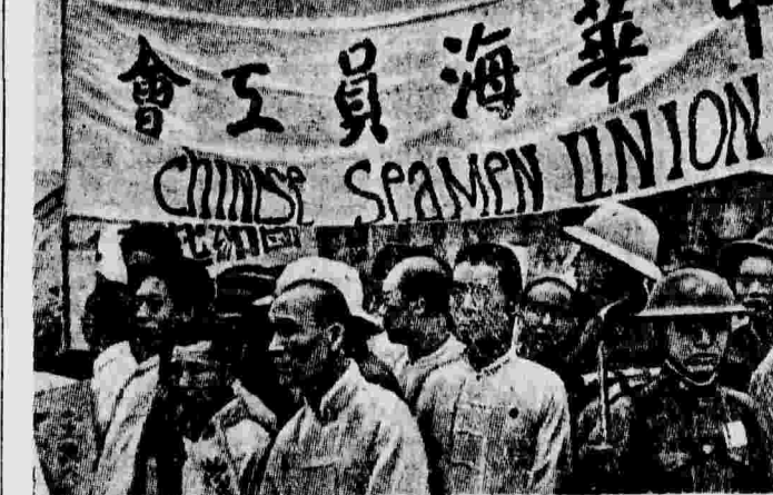
Члены китайского союза моряков на антияпонском митинге в Ханькоу.

БАРСЕЛОНА, 6 сентября. (ТАСС). Испанское министерство национальной обороны наградило знаками отличия 11-ю дивизию за проявленную ею героизм в продолжение всей войны и в особенности за блестящие операции на фронте Эбро. Знамя дивизии будет носить знак отличия. Министерство обороны наградило также медалью героя испанской войны полковника Листеры.