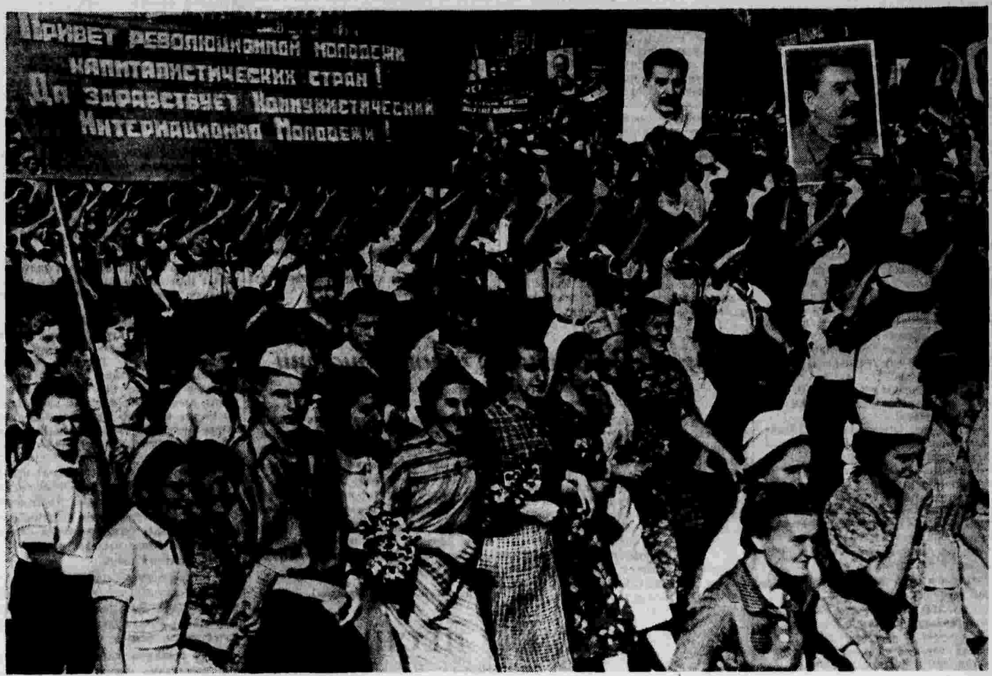
XXIV Международный юношеский день в Москве. Демонстранты проходят по Красной площади.

Миллионы молодых советских патриотов демонстрировали беспредельную преданность великой партии Ленина—Сталина, полную готовность защищать свою счастливую родину от любого врага.