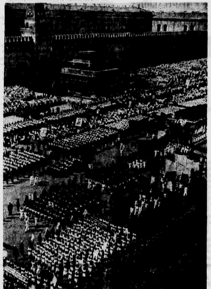
XXIV Международный юношеский день в Москве. Демонстрация на Красной площади.

ги, которая пользовалась колоссальным успехом. В начале сентября выставка переведена в Данию, где будет показана широкому слою населения.