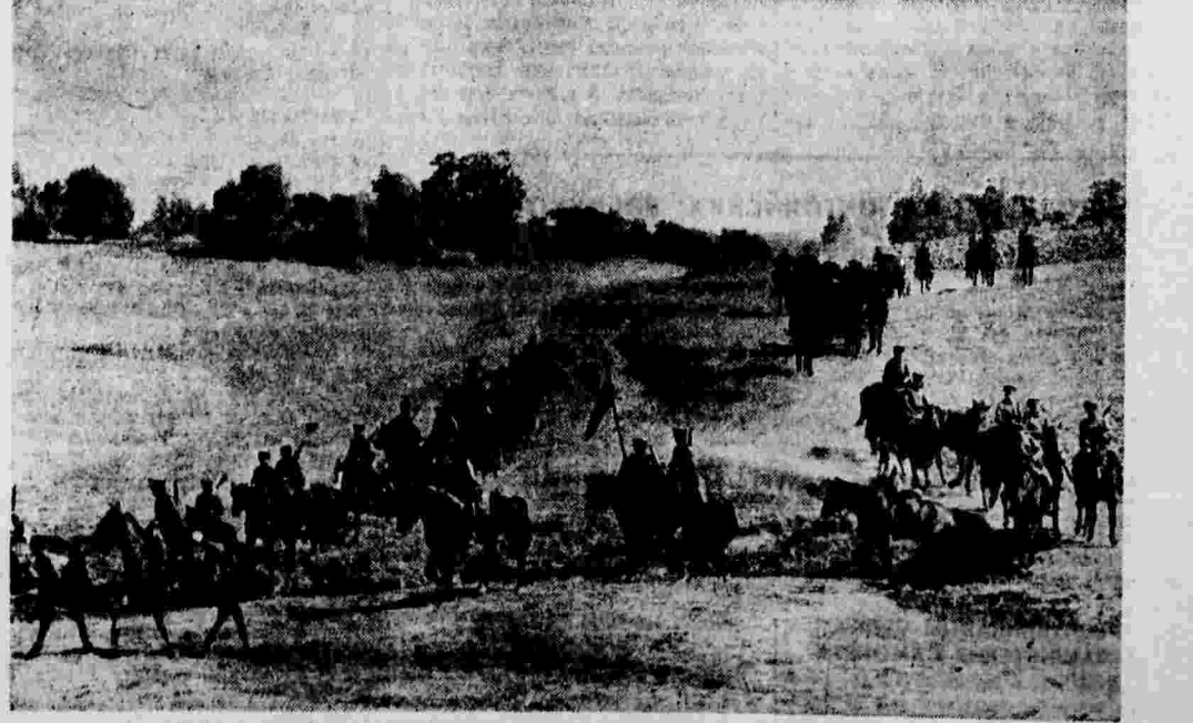
На тактических учениях частей Московского военного округа. На снимке — кавалерия в походе.