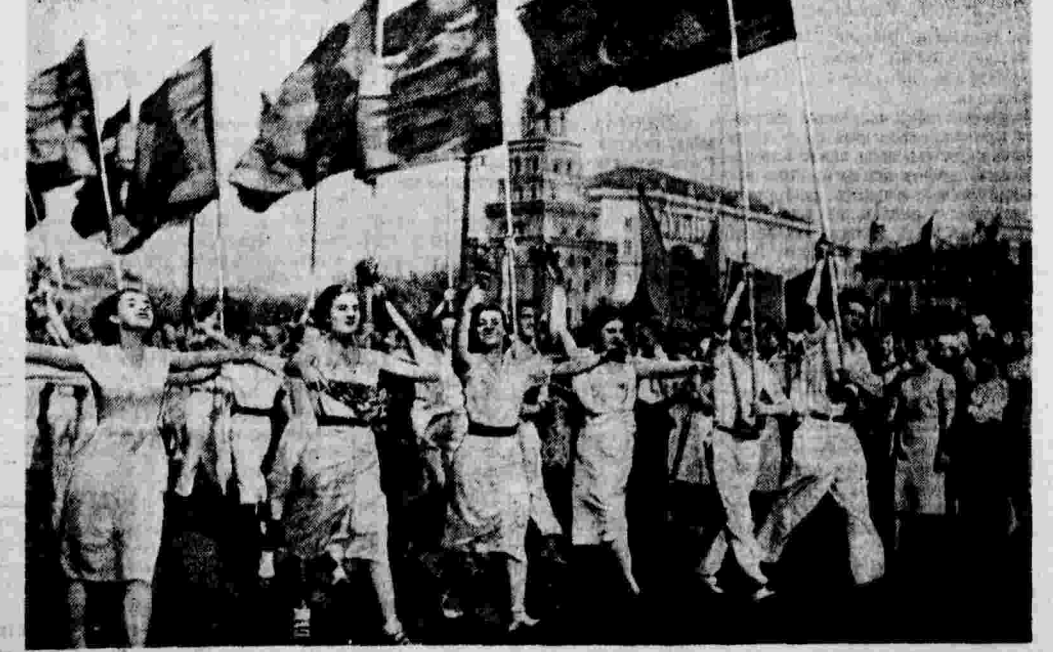
XXIV Международный юношеский день в Москве. На снимке: колонна Ленинского района направляется на Красную площадь.

Район учений, Московский военный округ. 6 сентября. (По телефону.)