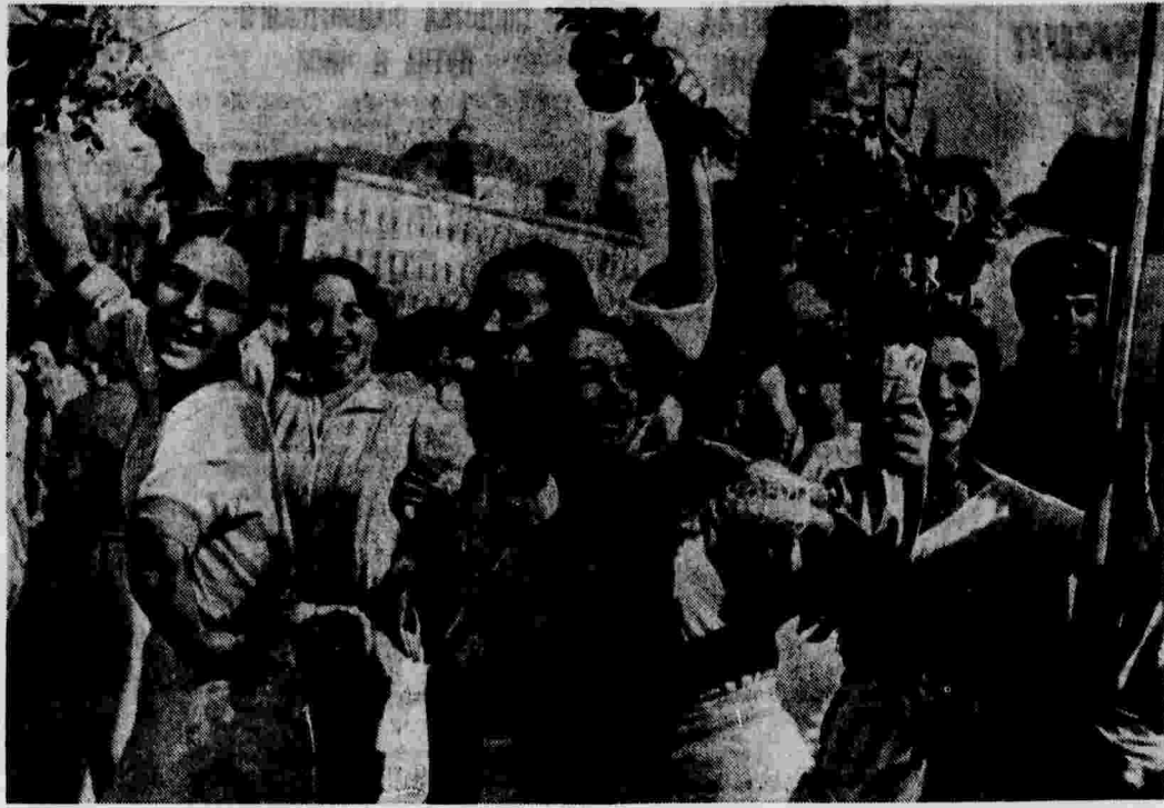
XXIV Международный юношеский день в Москве. На снимке: колонна молодежи у Большого Каменного моста.

8 сентября приступает к занятиям группа музыкально одаренных детей героической Испании. Их в школе 10.