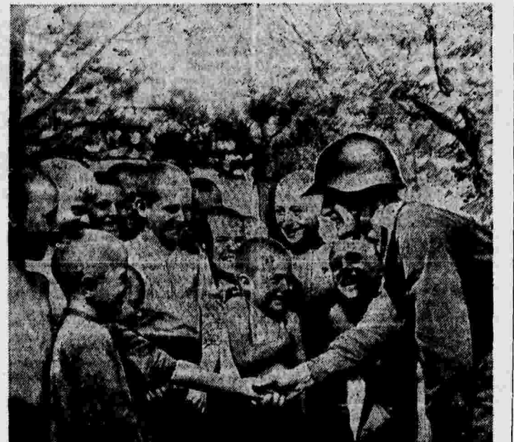
Политрук М. Н. Тереховкин (Н-ская часть Московского военного округа) беседует с детьми колхозников.