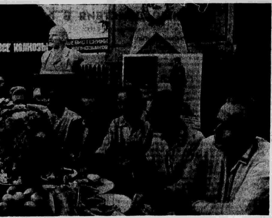
Вчера колхозники сельскохозяйственной артели «Памяти Ильича» (село Тарасовка, Мытищинского района, Московской области) проводили своих призванников-колхозников в Рабоче-Крестьянскую Красную Армию. На снимке — прощальный обед.

Предстояла трудная переправа. Свыше 200 метров водного пространства разделяли обе стороны. Скорость течения была около 2 метров в секунду.