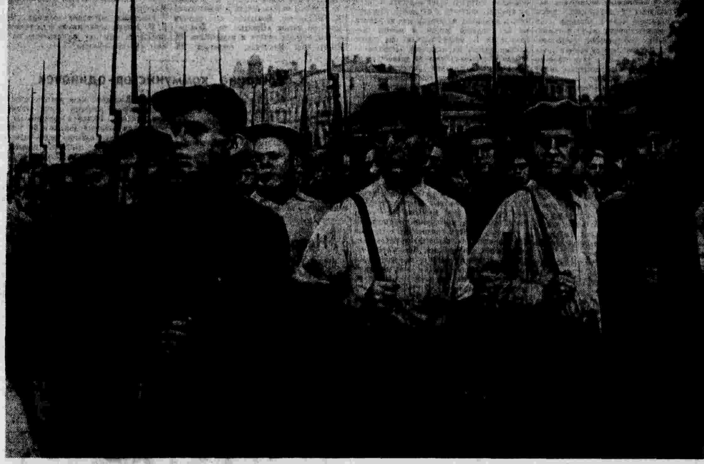
Молодежь Свердловского района (гор. Москва) готовится к демонстрации в честь Международного юношеского дня.

Два американских корреспондента — Джозеф Алсон и Роберт Квинтер, помещающие ежедневно совместно статьи по международным вопросам в газете «Вашингтон стар» и других газетах, пишут, что Рузвельт и государственный секретарь Халл настроены решительно против стран, которые нарушают международное право, мир и торговлю. Заместитель государственного секретаря Уэллес фактически поддерживает Рузвельта. Однако последние высшие чиновники государственного департамента, имеющие поддержку в известных кругах конгресса, — изоляционисты. В этих условиях Рузвельту в его сторонниках приходится считаться с изоляционизмом.