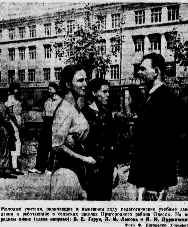
Молодые учителя, окончившие в нынешнем году педагогические учебные заведения...