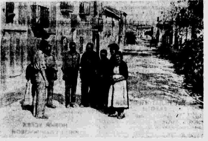
В отвоинной республиканскими войсками Испании деревне Мирвет де Эбро.

ПАРИЖ, 31 августа. (ТАСС). Германская армия в течение нескольких дней проводила маневры на германо-люксембургской границе. В этом районе проведены крупные фортификационные работы.