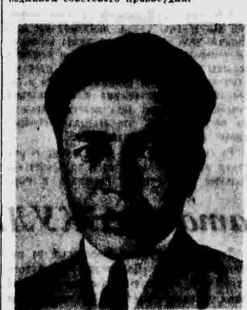
На пост наркома юстиции Туркмении выдвинута женщина-туркменка. Среди 70 народных судей Туркмении — 9 женщин-туркменок. Кроме того, одна туркменка является членом окружного суда и три туркменки — членами Верховного суда Туркменской республики. Две женщины-туркменки работают в качестве помощников прокурора нашей республики и свыше 7 тыс. женщин-туркменок — в качестве народных заседателей.

Я согласен с мнением выступавших депутатов и предлагаю проект «Положения о судопроизводстве СССР, союзных и автономных республик» с предложениями и замечаниями Комиссии Законодательных Предложений утвердить, ибо этот проект составлен в полном соответствии с основными законами нашей страны — Сталинской Конституцией, творцом которой является наш любимый вождь и учитель товарищ Сталин! (Альбионский).