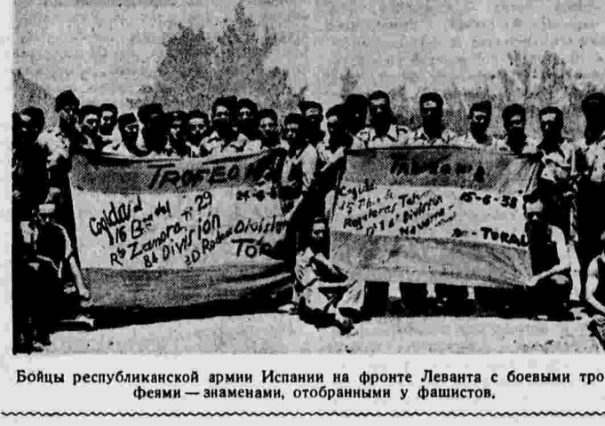
Бойцы республиканской армии Испании на фронте Леванта с боевыми трофеями — знаменами, отобранными у фашистов.

ЛОНДОН, 10 августа. (ТАСС). По официальному дипломатическому обозревателю агентства Рейтер, инглиский поверенный в делах в Риме Ноэль Чарльз во время беседы с интальянским министром иностранных дел Чано, 7 августа, указав, что Италия, вопреки соглашению о невмешательстве, продолжает оказывать содействие генералу Франко. При этом инглиский поверенный в делах заявил, что «французское правительство закрыло иренейскую границу и точно соблюдает соглашение о невмешательстве» с целью облегчить выполнение плана отъезда «сволонтеров» из Испании.