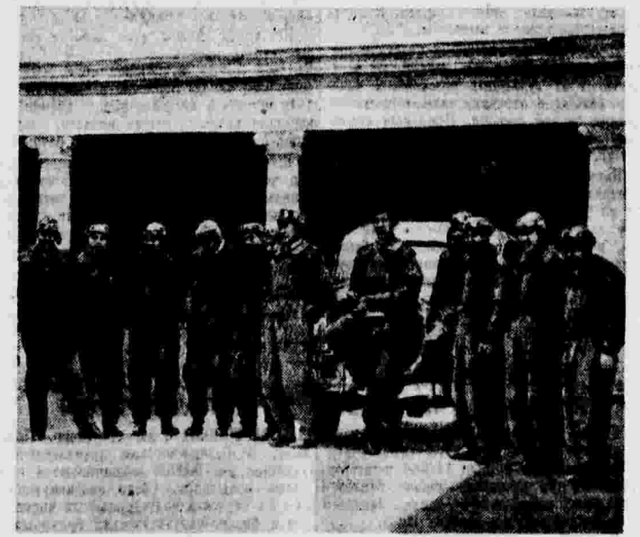
Группа летчиков китайской народно-революционной армии.

ПРАГА, 6 августа. (ТАСС). Как сообщала газета «Прагер митарг», в ночь на 29 июля в Бреславе (Германия) на квартире, где размещались прибывшие на «различные немецкого спорта» члены генеральных факультетских организаций, явились агенты Гестапо (германская тайная полиция) и учинили допрос генеральных факультетских организаций, мобилизованных чехословацким правительством 21 мая с. г. От резервистов требовали сведений следующего характера: название и местонахождение полка, в который призван; каковы вооружением были снабжены призванные; имели ли они противояды, и другие сведения шпионского характера. Особенно интересовались агенты Гестапо данными об укреплениях, построенных чехословацким правительством на границе с Германией и Австрией.