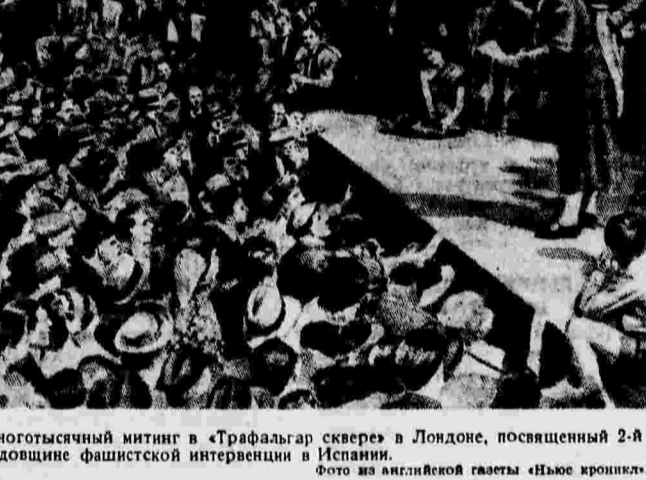
Многотысячный митинг в «Граффальгар сквере» в Лондоне, посвященный 2-й годовщине фашистской интервенции в Испании.

ПАРИЖ, 30 июля. (ТАСС). По сообщению агентства Гаваз, находящегося в Валенсии депутаты кортесов (испанского парламента) посетили недавно фронт Леванта.