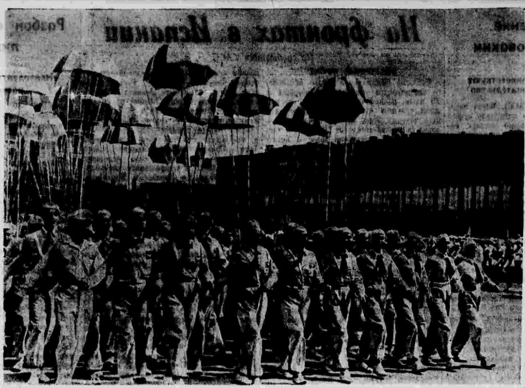
Вчера в Ленинграде на физкультурном параде. По площади Урицкого идут будущие парашютисты.