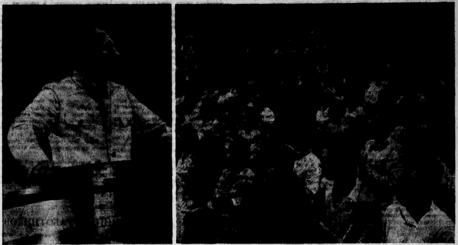
Выступление народного комиссара путей сообщения тов. Л. М. Кагановича в Зеленом театре Центрального парка культуры и отдыха им. Горького на собрании станочников-кривоносов Московского железнодорожного узла, посвященном всесоюзному «Дню железнодорожника».