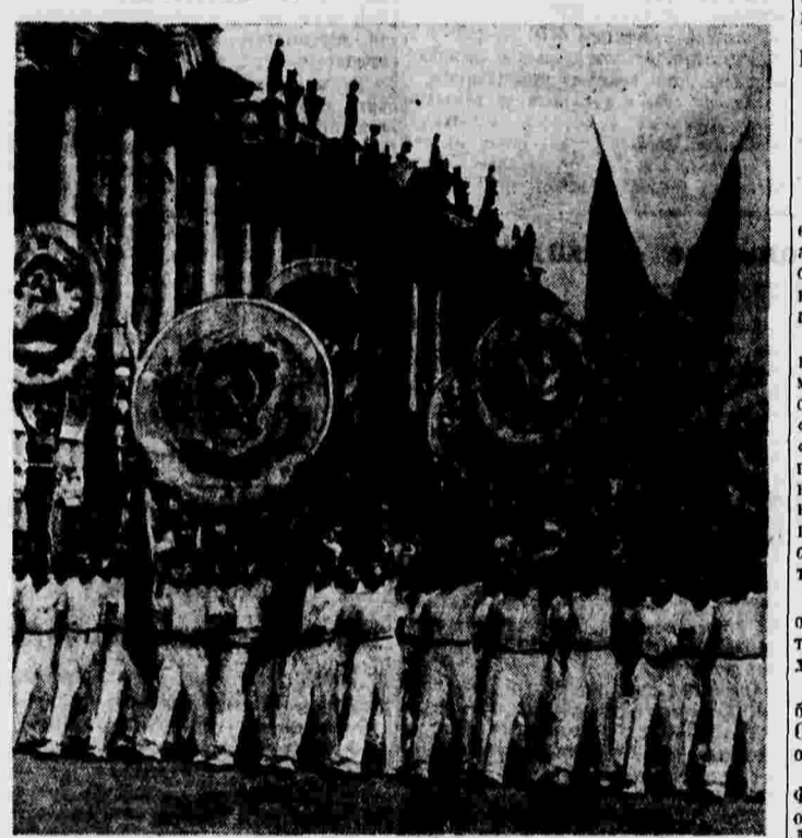
Парад физкультурников 30 июля в Ленинграде. На снимке: колонна студентов орденосного Института физкультуры им. Лесгафта.