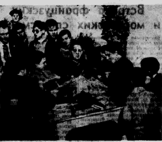
Распределение подарков, полученных для школьников Барселоны от женщин Чехословакии.

ПАРИЖ, 29 июля. (ТАСС). Агентство Эспанья передает, что генерал Франко издал новый «декрет» о горных концессиях на территории Испании, захваченной мятежниками. «Декрет» восстанавливает права 32 горных концессий, принадлежавших в Испании германским группам капиталистов.