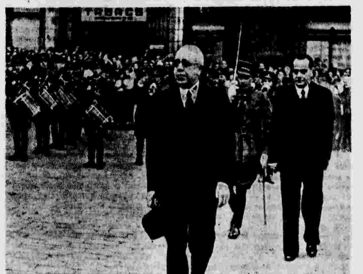
Барселона 18 июля 1938 года. На снимке: президент Испанской республики Асанья и председатель совета министров Негрину идут на собрание, посвященное двухлетию борьбы испанского народа против фашистских интервентов.

Посылка Ренсимена означает, что Англия и Франция ставят на одну доску законное правительство и гитлеровских агентов в Чехословакии. Под этим углом зрения нынешняя англо-французская инициатива в Центральной Европе аналогична французской инициативе в отношении Испании. Опыт, оказывается, ничему не научил. Французская инициатива в 1936 году повела к атаке войн в Испании, позволила фашизму завоевать часть страны и способствовала захвату Австрии. Нынешняя английская инициатива рискует повлечь за собой более тяжелые и более трагичные последствия».