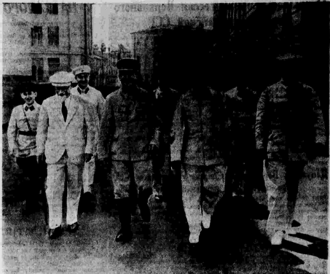
Товарищи Ежов, Калинин, Каганович, Сталин, Андреев, Ворошилов, Микоян и Молотов направляются на Красную площадь.