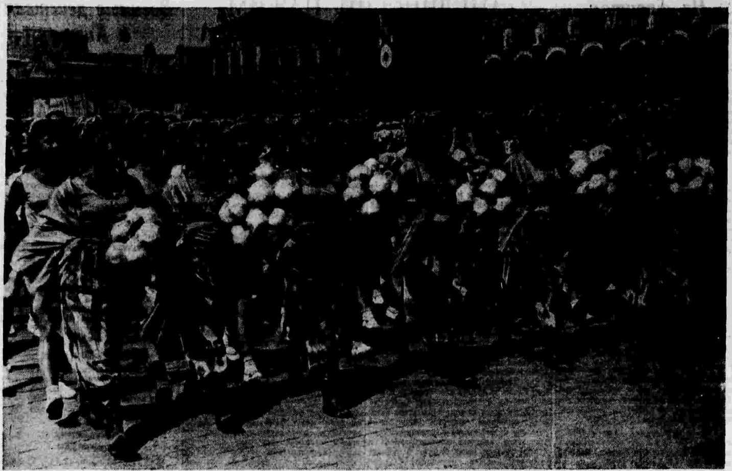
Всесоюзный парад физкультурников. На снимке: физкультурницы Узбекской Советской Социалистической Республики.

АДРЕС РЕДАКЦИИ И НАДЕЖНОСТИ: Москва, 40, Ленинградское шоссе, улица «Правды», Д-3-11-08; Информации — Д-3-15-90; Писем — Д-3-15-69 и Д-3-32-71; Объявления — Д-3-11-13; Секретариат редакции — Д-3-15-64.