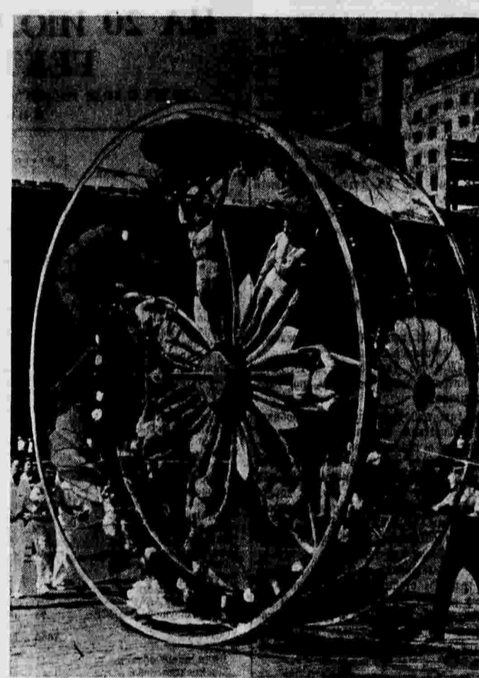
Всесоюзный парад физкультурников в Москве. На снимке: акробатическая группа и колонна физкультурников орденосного общества «Спартак».

(по плану маршрута) туристы знакомятся с ботаническим садом, краеведческим музеем и музеем Революции.