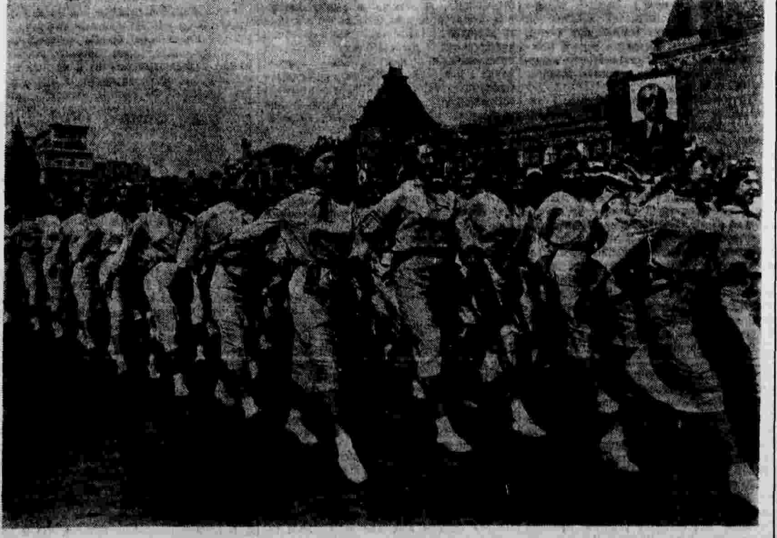
Всесоюзный парад физкультурников. На снимке: физкультурницы Украинской Советской Социалистической Республики.

Началась уборка урожая. Однако многие машинно-тракторные станции не обеспечены горючим. Запасов горючего в области хватит всего лишь на 3-4 дня. Главнефть исключительно плохо выполняет план заезда горючего. В июле область должна была получить 4.290 тонн керосина. Завезено же пока около 2 тысяч тонн. Часть этого керосина еще путешествует по линиям железных дорог. План заезда бензина и лигрона выполнен меньше чем на одну треть. Главнефть планирует увеличение заезда горючего и в то же время сокращает отпуск этих продуктов. (Морр. «Правды»).