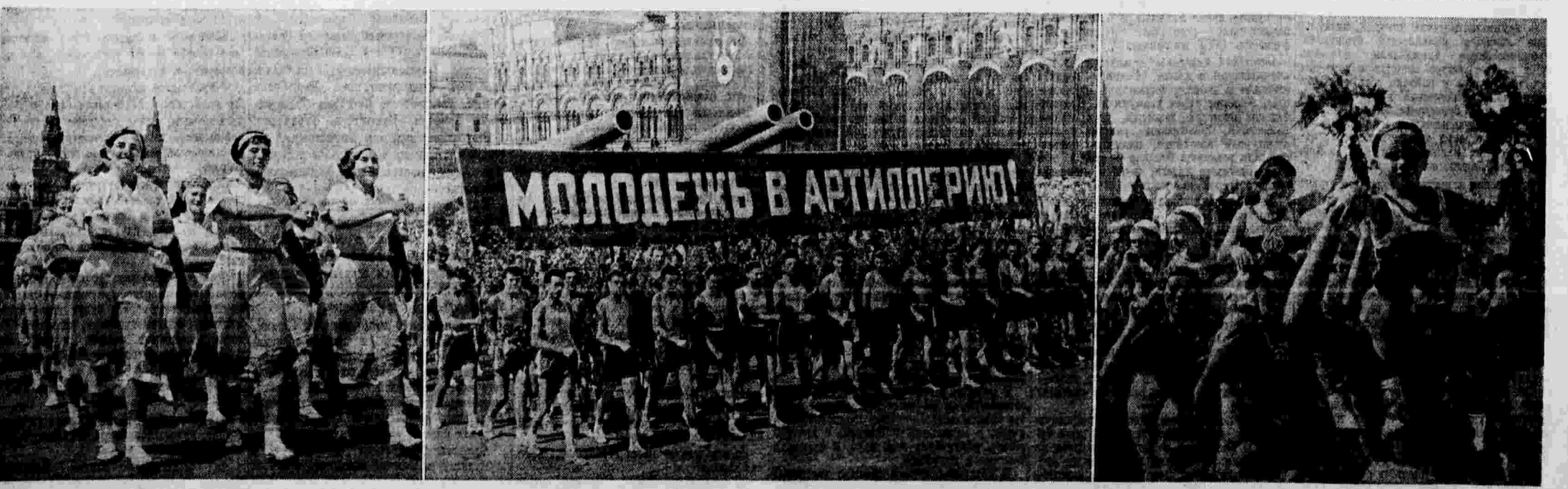
Всесоюзный парад физкультурников. На снимках: слева — физкультурницы Белорусской Советской Социалистической Республики; в центре — колонна спортивного общества «Снайпер»; справа — физкультурницы спортивного ордена Ленина общества «Динамо» — матери с детьми.