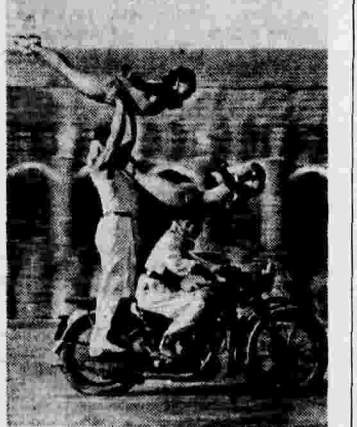
Всесоюзный парад физкультурников. На снимке: акробатический номер на мотоцикле в исполнении студентов Государственного ордена Ленина института физической культуры имени Сталина.

В некоторых районах Ростовской области размещение займа пореже идет медленно. В этом повинны финансовые органы.