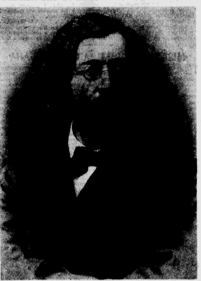
Николай Гаврилович Чернышевский (1828—1899 гг.)

Производится реконструкция и капитальный ремонт существующих линий. В связи с расширением автомобильного завода имени Сталина трамвайные рельсы, пересекающие новую заводскую территорию, убраны, а взамен их, в обход завода, строится новая линия.