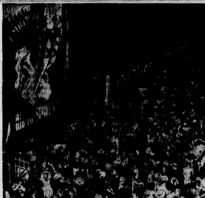
Демонстрация солидарности с испанским народом в Нью-Йорке. На плакате надписи: «Долой эмбарго!», «Помогите Испании!» (Сингапур).