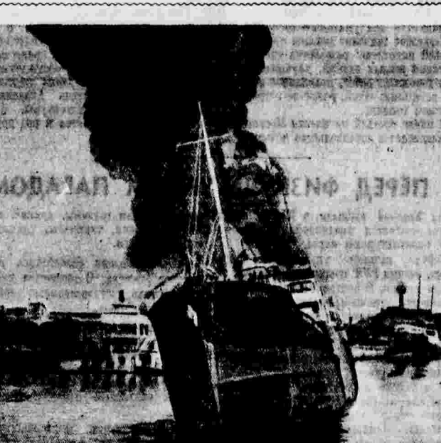
Английский пароход «Арон», подвергшийся в Валенсийском порту (Испания) нападению со стороны итало-германской авиации.

Население Валенсии, не поддаваясь панике, активно участвует в обороне города.