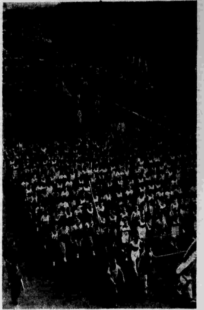
Физкультурники готовятся к параду, который состоится 24 июля в Москве. На снимке: колонны физкультурников на Большой Кадушской улице.