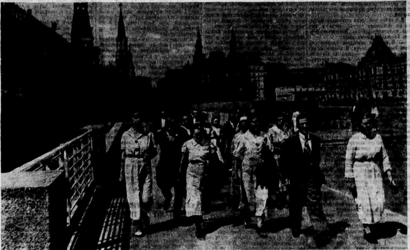
Депутаты Верховного Совета РСФСР идут в Кремль на очередное заседание Первой Сессии Верховного Совета РСФСР.

ИЗБРАНИЕ ПРЕЗИДИУМА ВЕРХОВНОГО СОВЕТА РСФСР.