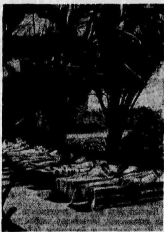
Детский санаторий в г. Олива, организованный республиканским правительством.

Председатель совета министров Испанской республики, министр национальной обороны.