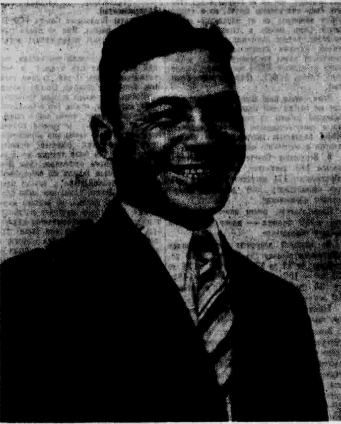
Герой Советского Союза В. К. Коккинаки.