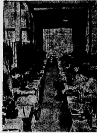
Работа испанских женщин на оборону. На снимке: португальская мастерица, изготавливающая обмундирование для республиканской армии.