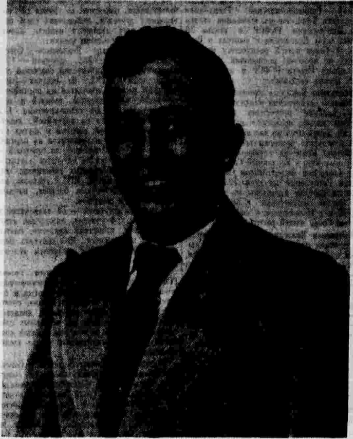
Герой Советского Союза А. М. Брядинский.