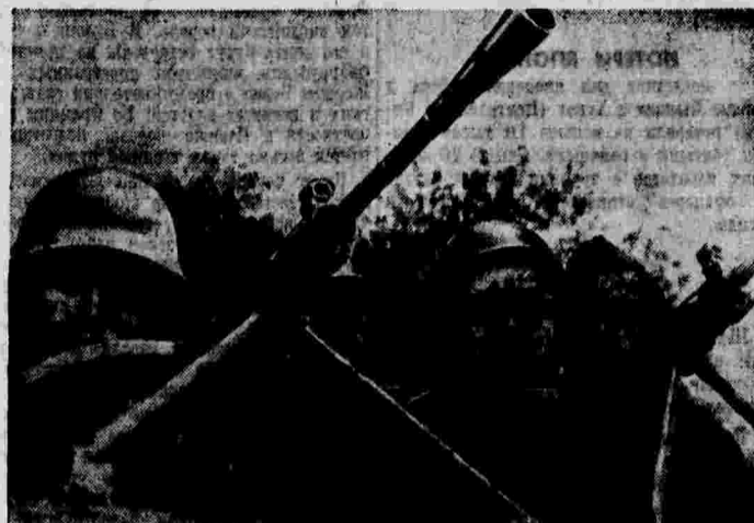
Бойцы испанской республиканской армии.