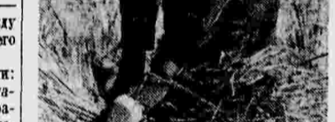
Боец республиканской армии Испании помогает крестьянам в уборке урожая.

В Лондоне состоялось собрание профсоюза моряков торгового флота.