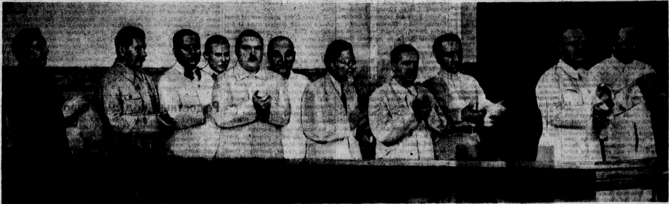
Товарищи Маленков, Сталин, Ворошилов, Ежов, Жданов, Шкирятов. Калинин, Андреев, Микоян, Молотов и Каганович — на Первой Сессии Верховного Совета РСФСР.