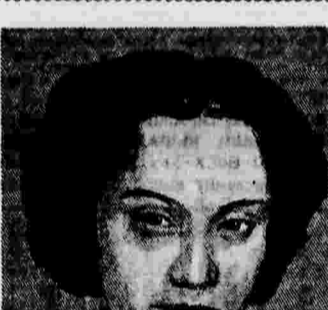
Китайская сестра милосердия — доброволец.

ЛОНДОН, 15 июля. (ТАСС). Как уже сообщалось, английское правительство отказалось предоставить Китаю заем.