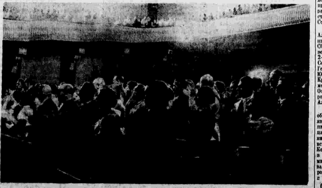
В зале заседаний Верховного Совета РСФСР. Депутаты приветствуют товарища Сталина.

(Продолжение отчета о встрече героев-летчиков в Москве — на 3-й стр.)