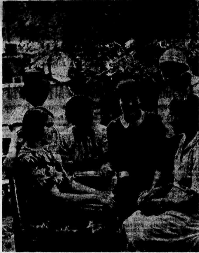
Собрание партийной группы 3-го цеха московской фабрики «Красная оборона» (гост «Мосбель»).

выбрали тов. В. И. Кагановича, вторым секретарем — тов. Давыдова и третьим секретарем — тов. Рыжкова.