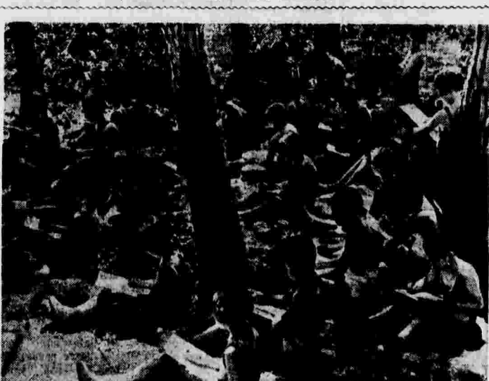
Забота республиканского правительства Испании о детях. На снимке: дети в организованной правительством колонии во время занятий на открытом воздухе.

ШАНХАЙ, 13 июля. (ТАСС). Китайские партизаны ведут весьма активные операции в восточной и южной части провинции Шаньши.