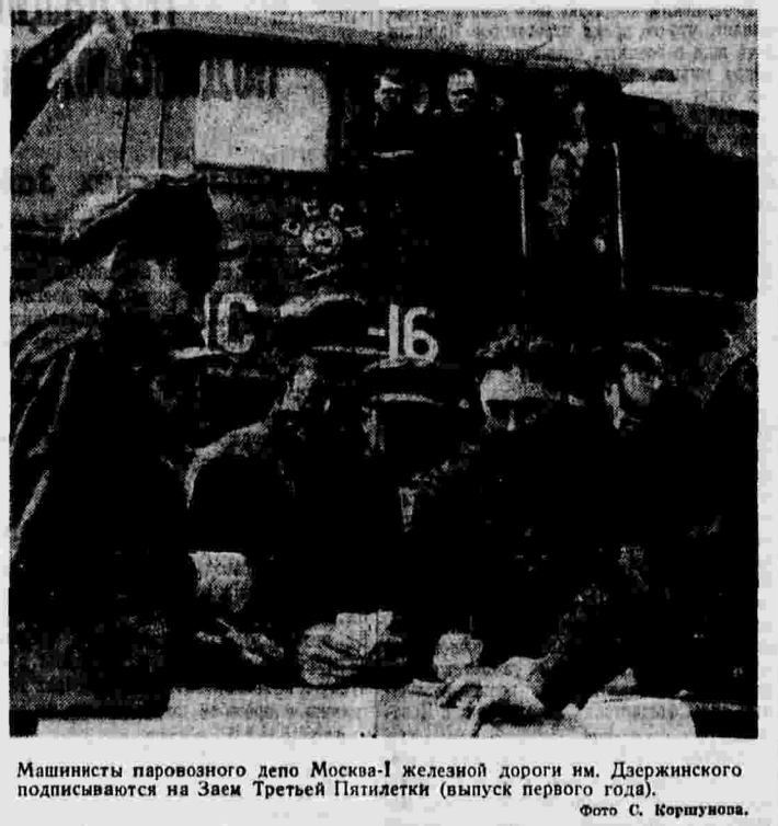
Машинисты паровозного депо Москва-1 железной дороги им. Дзержинского подписываются на Заем Третьей Пятилетки (выпуск первого года).

С отчетным докладом о работе Красноярского крайкома партии выступил исполняющий обязанности первого секретаря крайкома ВКП(б) тов. Кулаков.