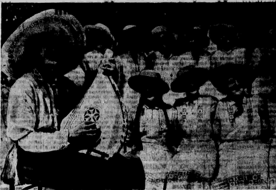
Участники украинского конкурса колхозной самодеятельности в Киеве — колхозники Харьковской области.

Кроме того, около 2.500 учителей будут выпущены в поле педагогическими училищами.