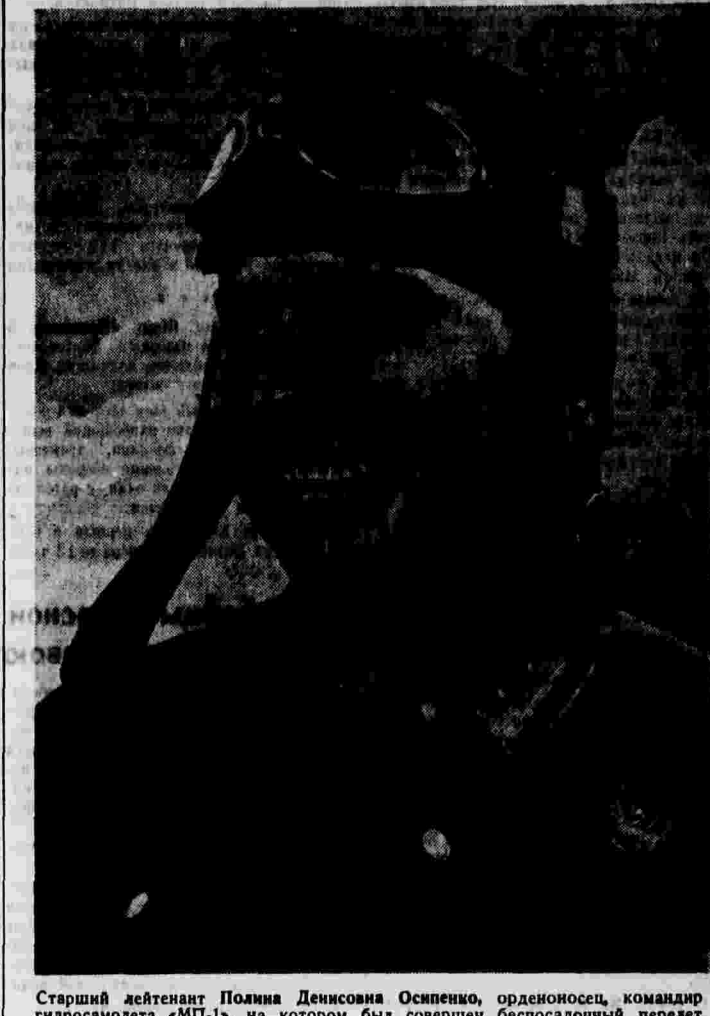
Старший лейтенант Полина Денисовна Осипенко, орденоси, командир гидросамолета «МП-1», на котором был совершен беспосадочный перелет Севастополь—Архангельск.

В течение трех лет гитлеровская Германия осуществляет в отношении Франции стратегический маневр весьма широкого размаха. Цель этого маневра проста: дело идет о том, чтобы изолировать Францию, оторвать от нее ее союзников.