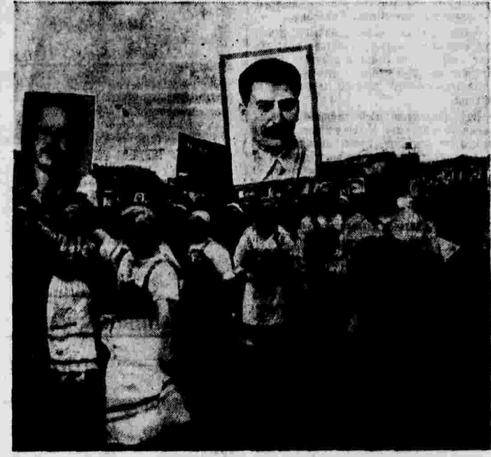
Демонстрация трудящихся г. Ленинграда, посвященная итогам выборов в Верховный Совет РСФСР.

После окончания демонстрации все участники ее направлялись на стадион «Динамо», где состоялась физкультурные игры и соревнования.