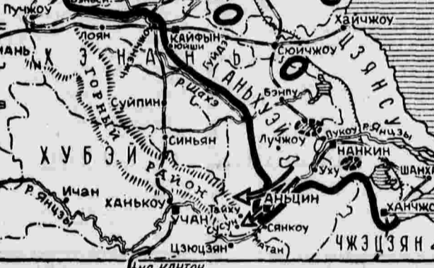
Линия фронта китайские части в тылу японцев районы действий китайских партизан направление японского наступления

ТОКИО, 29 июня. (ТАСС). Газета «Никан Бюгю» отмечает рост безработицы в Японии. Газета пишет, что в настоящий момент, когда правительство ограничило производство и потребление ряда важнейших материалов, количество безработных увеличилось с 329,760 человек в прошлом году до 800,000 человек. Эти данные преувеличивают действительное число безработных в Японии.