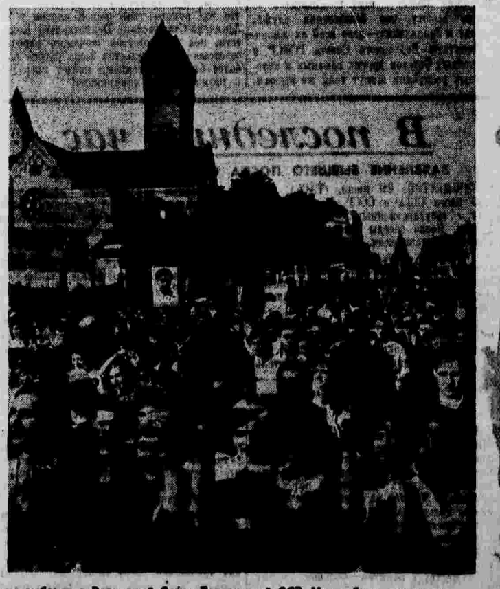
Многотысячные митинги и демонстрации охватывают теперь в Мемельской, Чикаго, Омске, Петроградском, Сергеев, Мамале, Демидовском, Сталине, Одессе, Калинин, Ординский, Ярославле, Ульянове, Орле и других городах. В редакции «Правды» до поздней ночи поступали сообщения о многочисленных общегородских демонстрациях в честь выборов депутатов в Верховные Советы союзных и автономных республик.