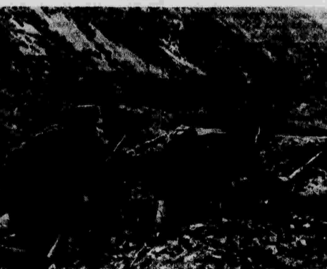
В Пиренейских горах, в тылу интервентов, сражается 43-я дивизия испанской республиканской армии. На снимке: бойцы 43-й дивизии в засаде.