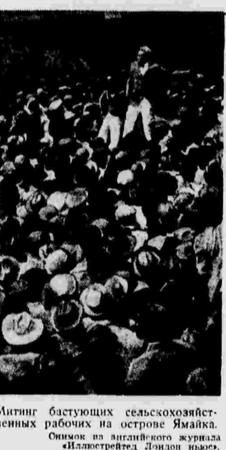
Митинг бастующих сельскохозяйственных рабочих на острове Ямайка. Снимок из английского журнала «Иллюстриейд» Лондон выпуска.

* 15 июня в Каталонии устраивается праздник книги. В этот день проводятся лекции, посвященные значению литературы. Книжные магазины организуют выставки и продают книги со скидкой. * В специальном трибунале Барселоны начался процесс 15 судей, обвиняемых в умышленном вынесении оправдательных приговоров при разборе дел фашистов. Большинство подсудимых признало себя виновными. * В Китае организована «Ассоциация по оказанию помощи сырым войнам». В Тяньцзинь (крупный китайский город, захваченный японцами) недавно неизвестными лицами были брошены бомбы в двух кинотеатрах. В связи с этим японские власти арестовали свыше 300 китайцев. * В конце июня случится в испанской воздушной линии Вухарет — Станбул. * В Милане (Италия) произошла большая железнодорожная катастрофа. 13 человек ранено, один убит.