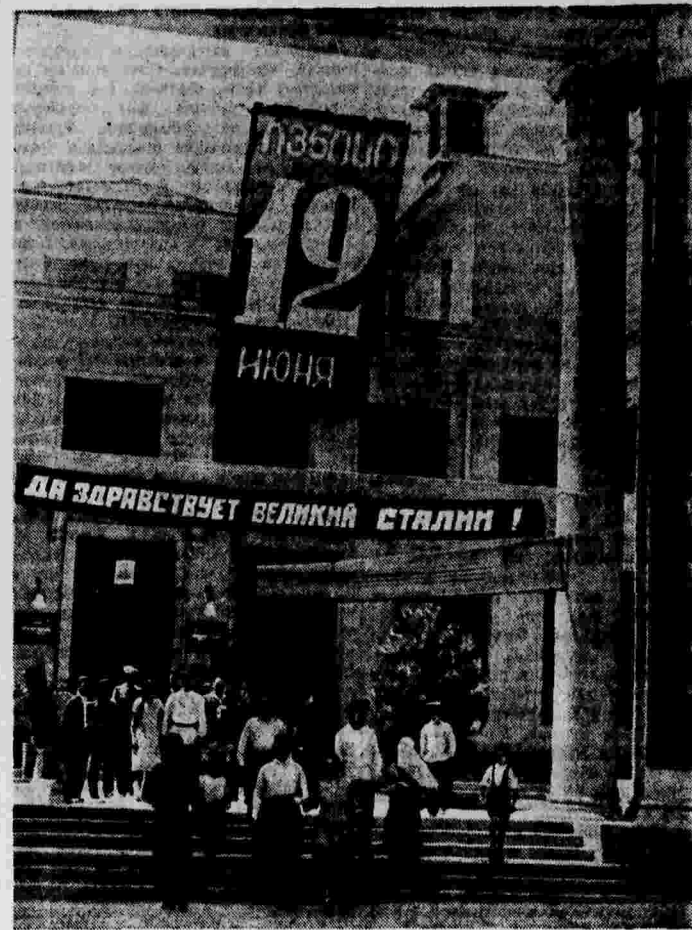
Выборы в Верховный Совет Грузинской ССР. Избиратели после голосования выходят из помещения 8-го избирательного участка округа им. Энгельса (г. Тбилиси).