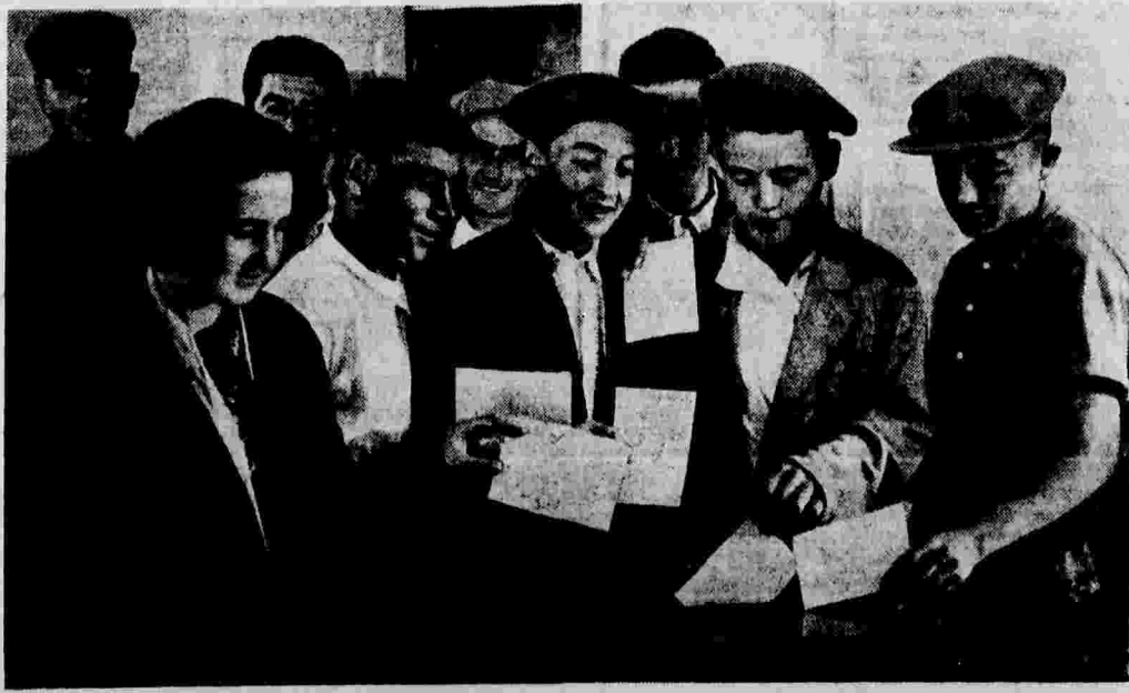
Выборы в Верховный Совет Армянской ССР. На избирательном участке № 1 избирательного округа СК № 1 г. Еревана, где баллотировалась кандидатура товарища Сталина. На снимке: молодые избиратели у избирательного урна. (Снимок доставлен на скоростном самолете летчиком тов. Новиковым).

ГРАСНОВАЯ УМАНЕЦ. Председатель колхоза им. Молотова, Белоцерковский район, Киевской области.