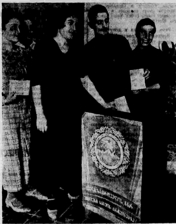
Выборы в Верховный Совет Грузинской ССР. В Ленинском избирательном округе № 1 города Тбилиси, где баллотируется кандидатура товарища Сталина. На снимке: слева — у избирательной урны на избирательном участке № 8. Справа — танцы у входа в избирательный участок № 7. (Снимок доставлен на скоростном самолете летчиком тов. Новиковым).

Пусть живет и здравствует сталинская дружба свободных и непобедимых народов Союза Советских Социалистических Республик!