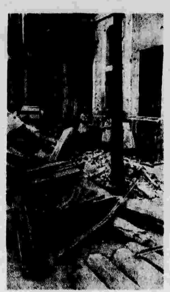
Бомбардировки Гранольерса италогерманской авиацией. Разрушения на одной из улиц города.

обещание весь мир. — Фотографии детей, убитых фашистской авиацией в Мадриде. — Посреди улицы — разбитый фонарь. Клавиатура отброшена на тротуар. Порванные