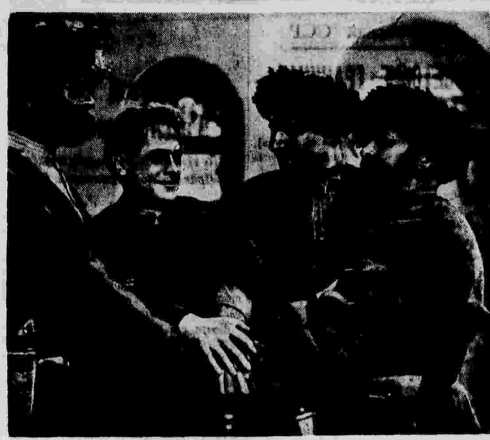
Кадр из фильма «Друзья».

«Закон о наследственных дворах» определяет всю жизнь и быт современной германской деревни. Этот закон, выданный императором, помещиком и кулаком верхушкой, вносит разлад и разделение в крестьянские семьи.