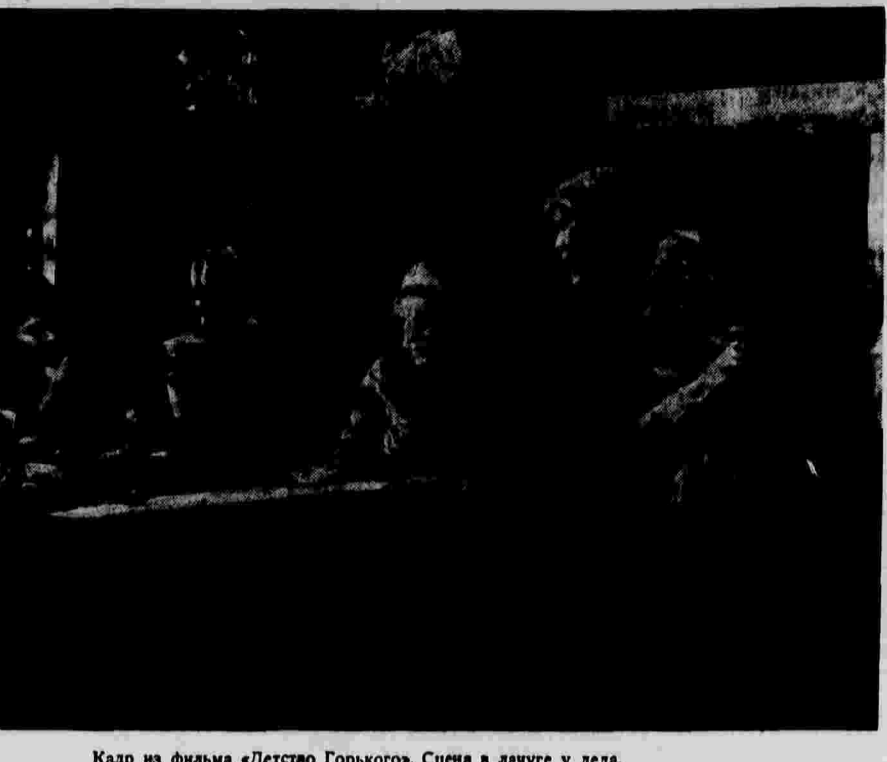
Кадр из фильма «Детство Горького». Сцена в лугу у деду.

В советские годы Горький много раз возвращался к вопросу: знает ли новое, молодое поколение нашей страны, как жило народу в дореволюционной России?