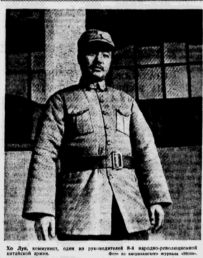
Хо Лу, коммунист, один из руководителей 8-й народно-революционной китайской армии.

можно узнать об антивосточных настроениях японской армии. Имеются также документы, свидетельствующие о бесчеловечной жестокости японской армии по отношению к китайским пленным и к мирному населению. На выставке приводятся официальные данные о количестве захваченного китайскими войсками военного снаряжения. С момента начала войны по 30 апреля китайские войска захватили свыше 21.400 винтовок, 1.237 пулеметов, 101 траншейную мину, 40 орудий и 85 танков. Кроме этого, выданы на действия 149 орудий, 246 танков, 2.229 грузовиков, 46 зенитных орудий и 381 траншейная мина.