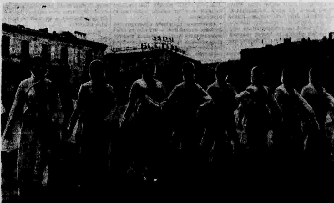
Физкультурный парад в Тбилиси. На снимке: колонна физкультурниц.

К лицу ли центральной украинской газете игнорировать воле партийной конференции, наварывать ей свои неподобающие заключения и этим самым дезориентировать харьковских коммунистов?